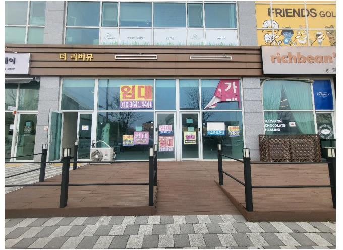
( 119 , 120 )