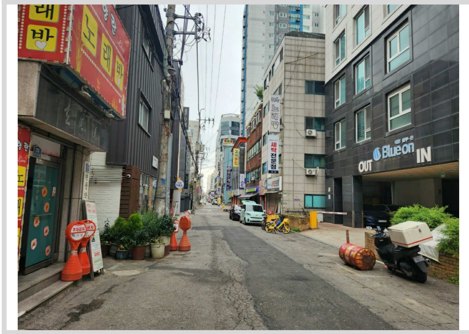
북측 도로변 전경