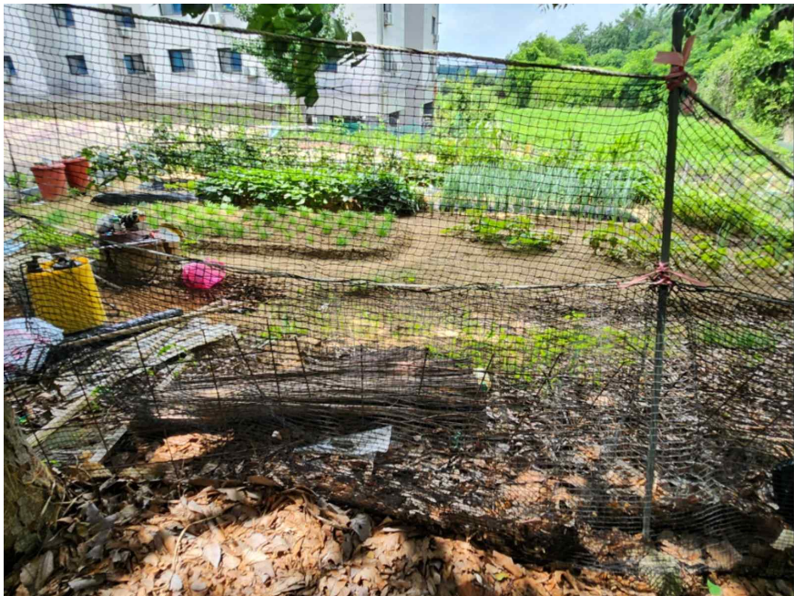
기호 1 전경