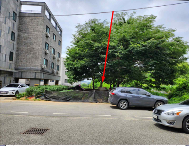
기호 1 전경