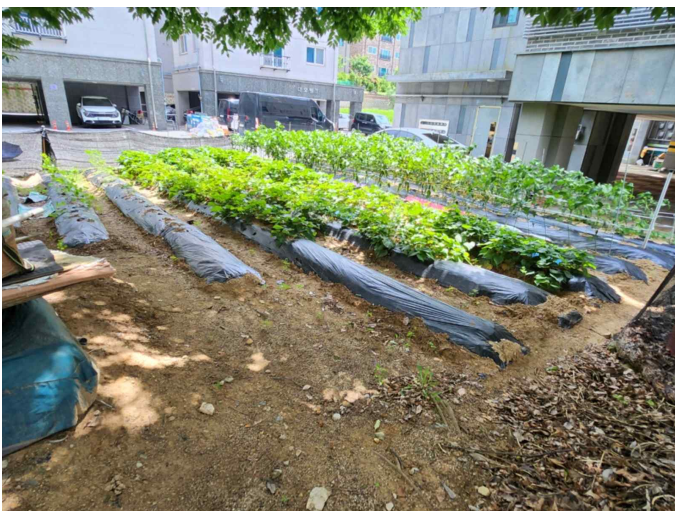
기호 1 전경