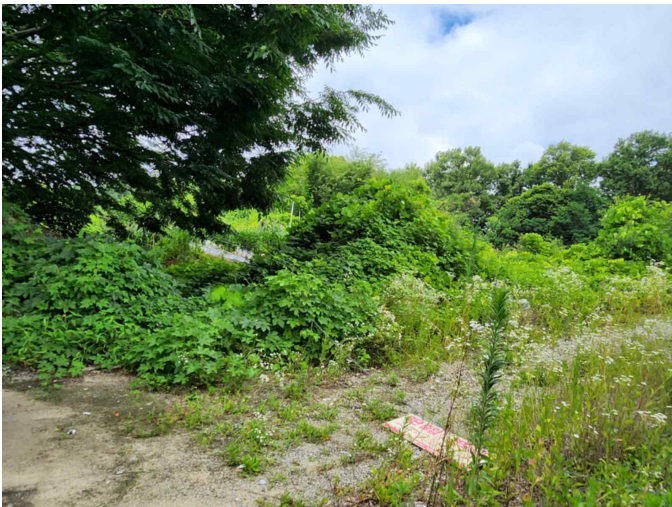
기호 1 전경