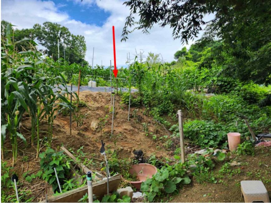
기호 2 전경