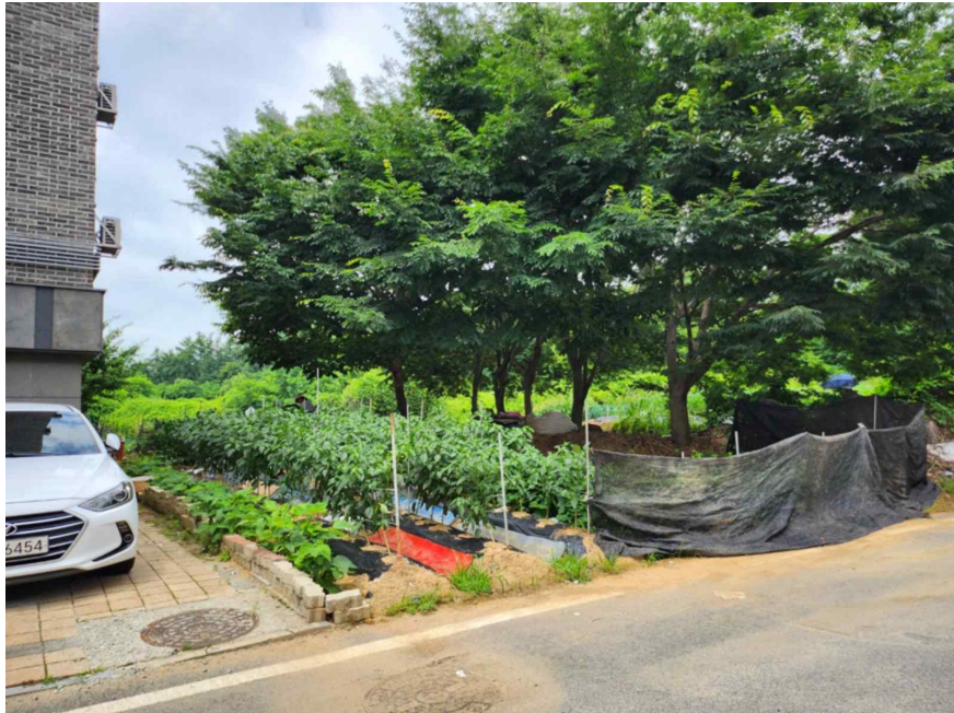
기호 1 전경