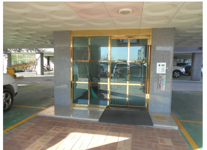
1층 공동출입구 전경