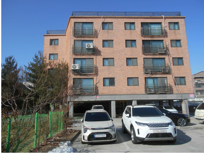
본건 전경1(동측 인근에서 촬영)