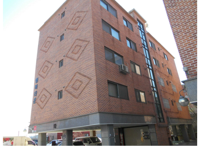
본건 전경2(북서측 인근에서 촬영)