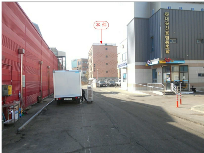
주변 전경(북동측 인근에서 촬영)