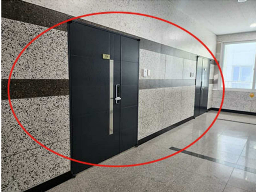
본 건 현 관 문