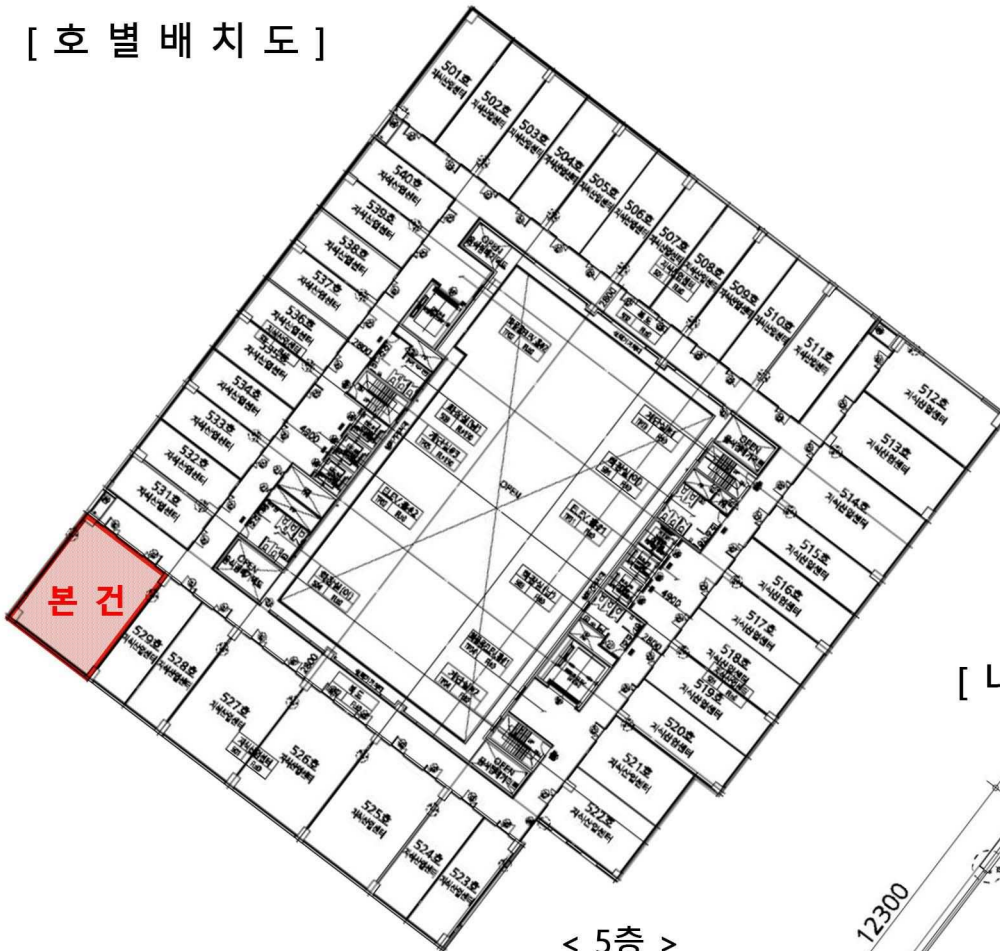
< 5층 >