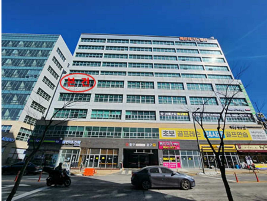
본 건 전 경