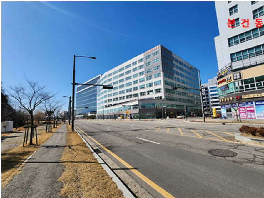
주 변 전 경