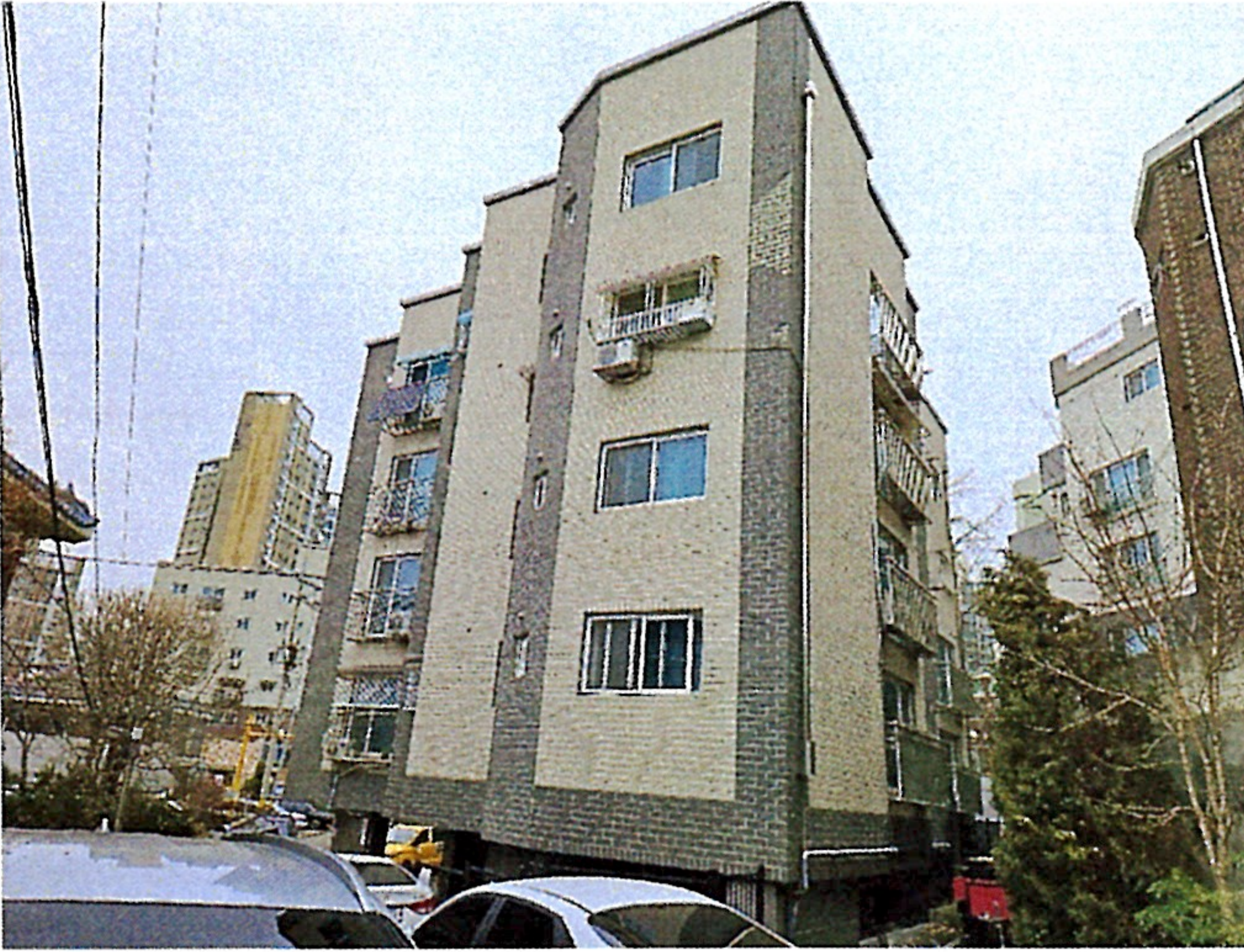
본건이 속한 동 측후면 전경