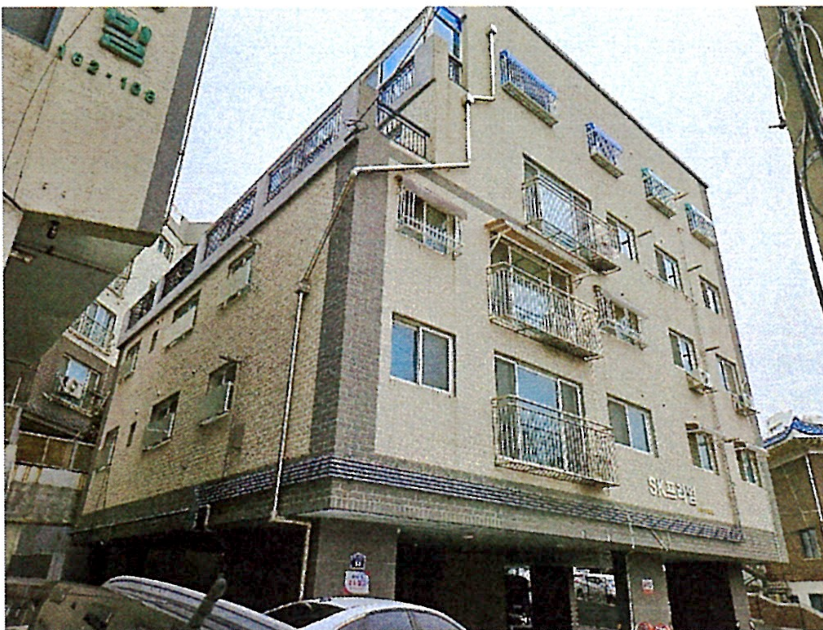
본건이 속한 동 측후면 전경