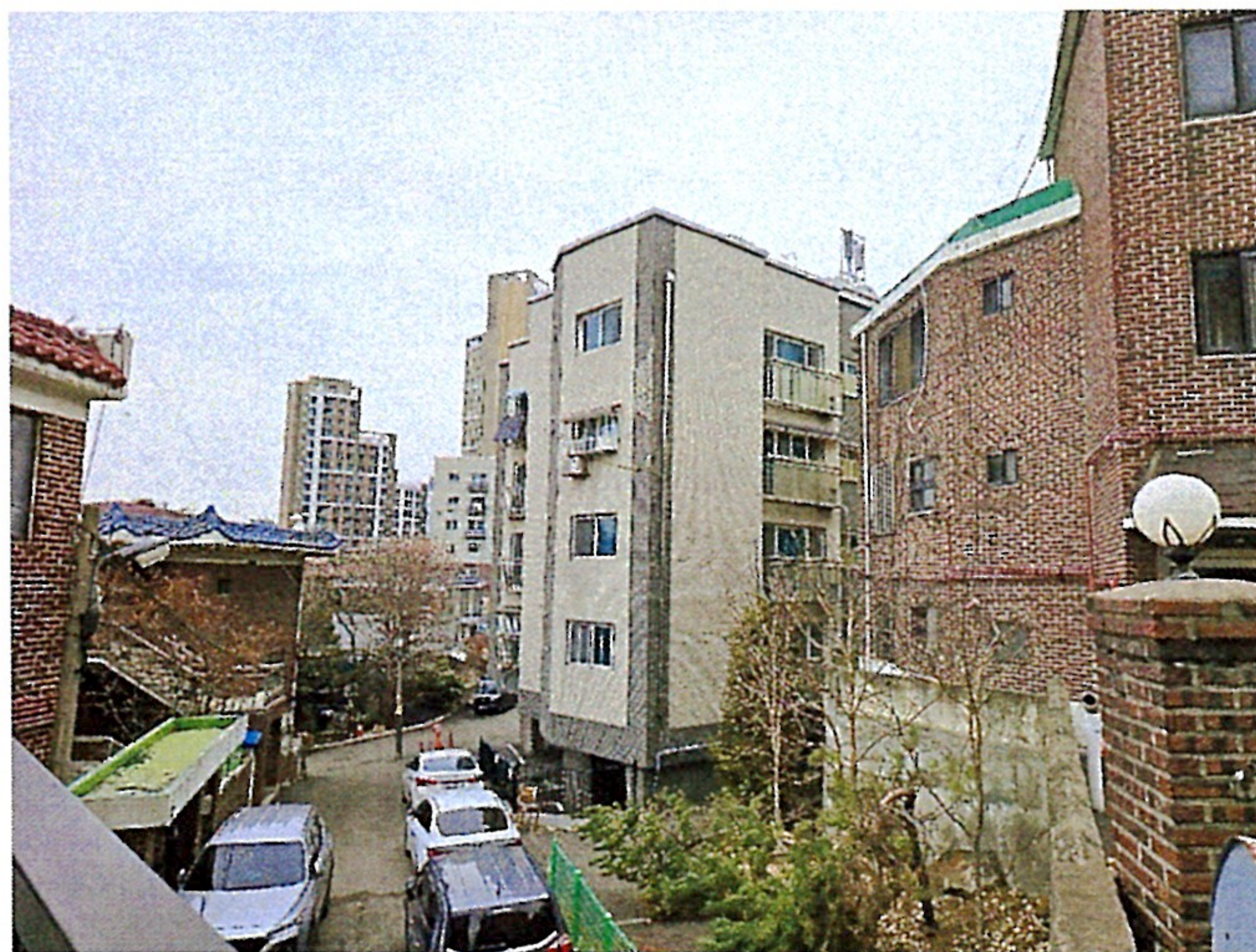
본건 인근 전경