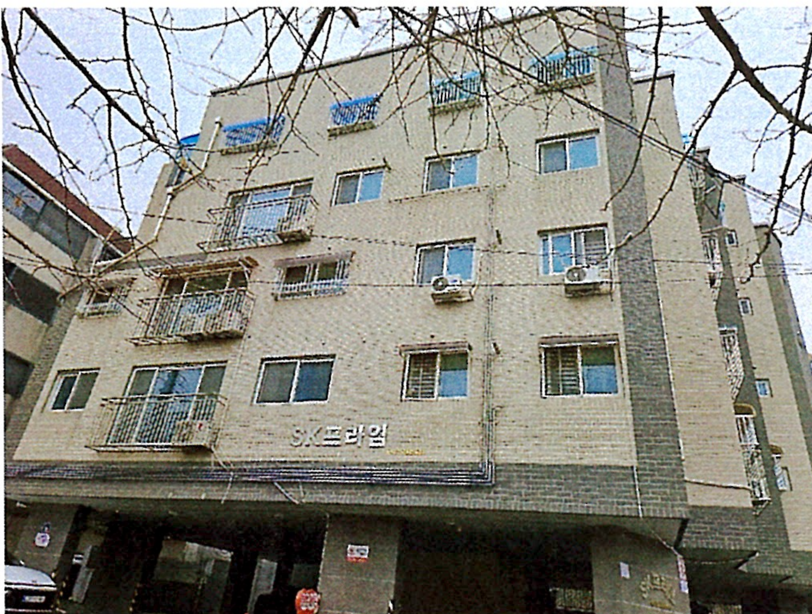
본건이 속한 동 전경