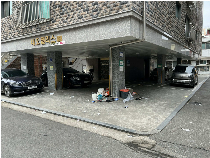
1층 주차장 부분