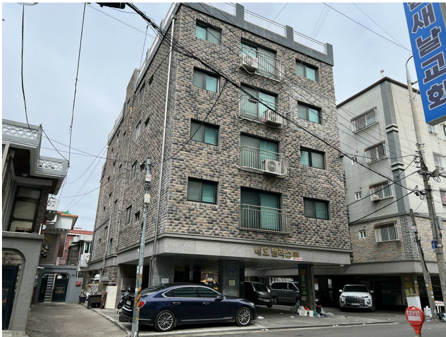
본건 전경 2