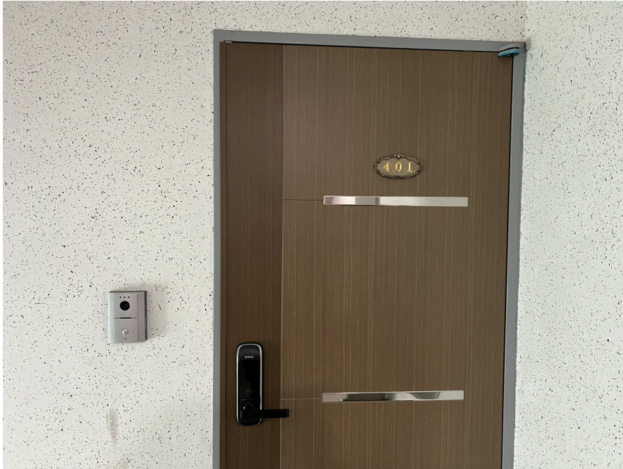
본건 외부 현황