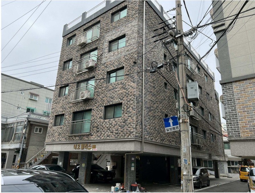
본건 전경 1