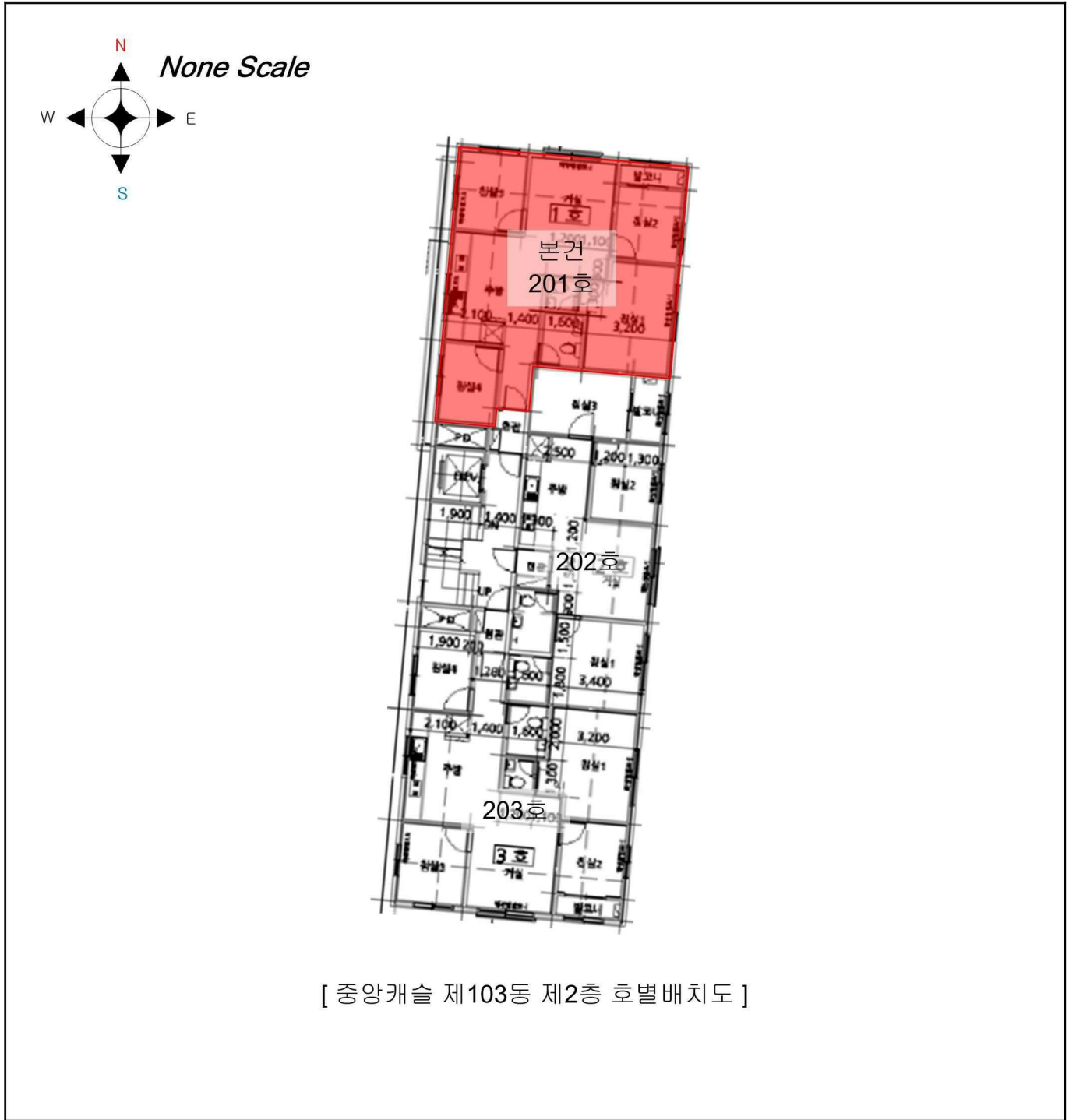
[ 중앙캐슬 제103동 제2층 호별배치도 ]