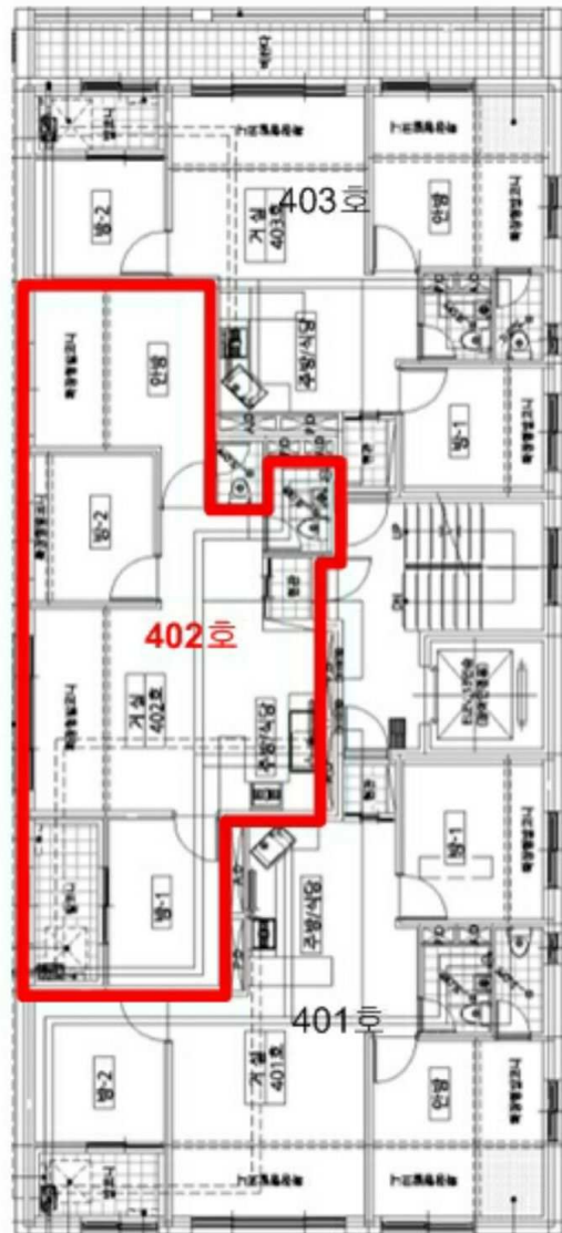
본건 [ 대현빌 4층 402호 ]