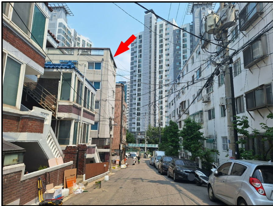
[ ( ) - ]