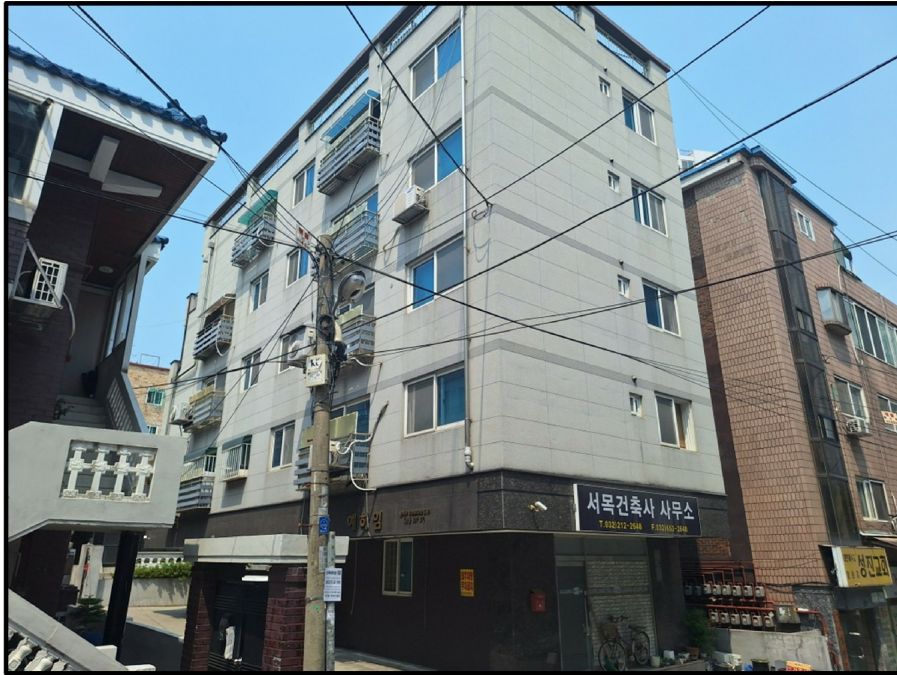
[ - ]