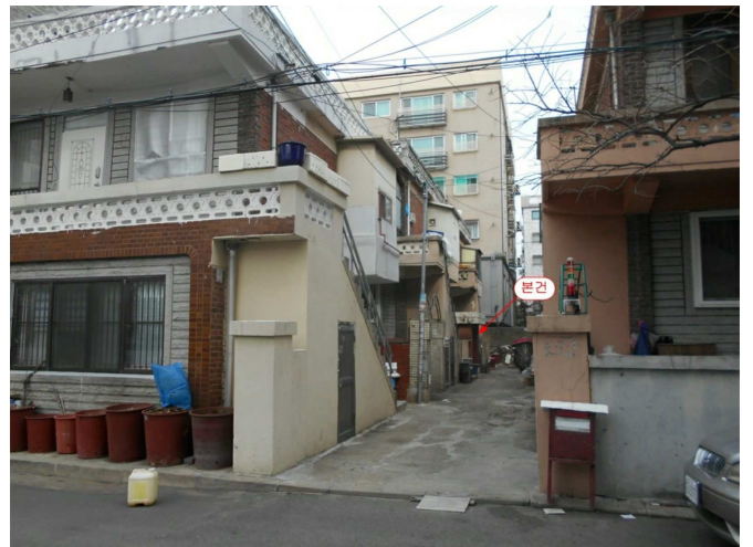
주변 전경(남측 인근에서 촬영)