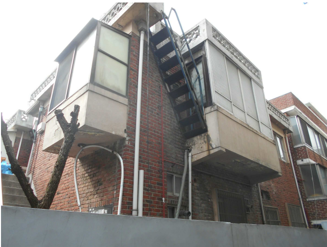
본건 전경3(북동측 인근에서 촬영)