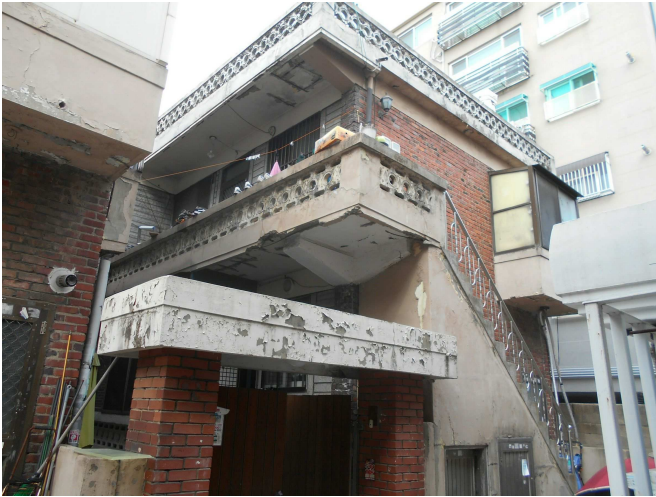
본건 전경1(남동측 인근에서 촬영)