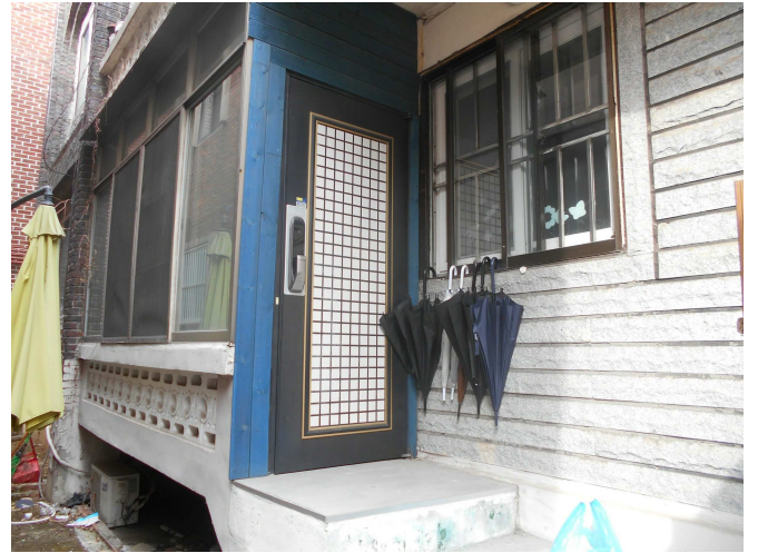
본건 전경2(남동측 근접하여 촬영)