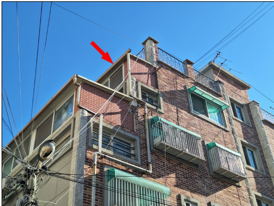
[ ( ) ]