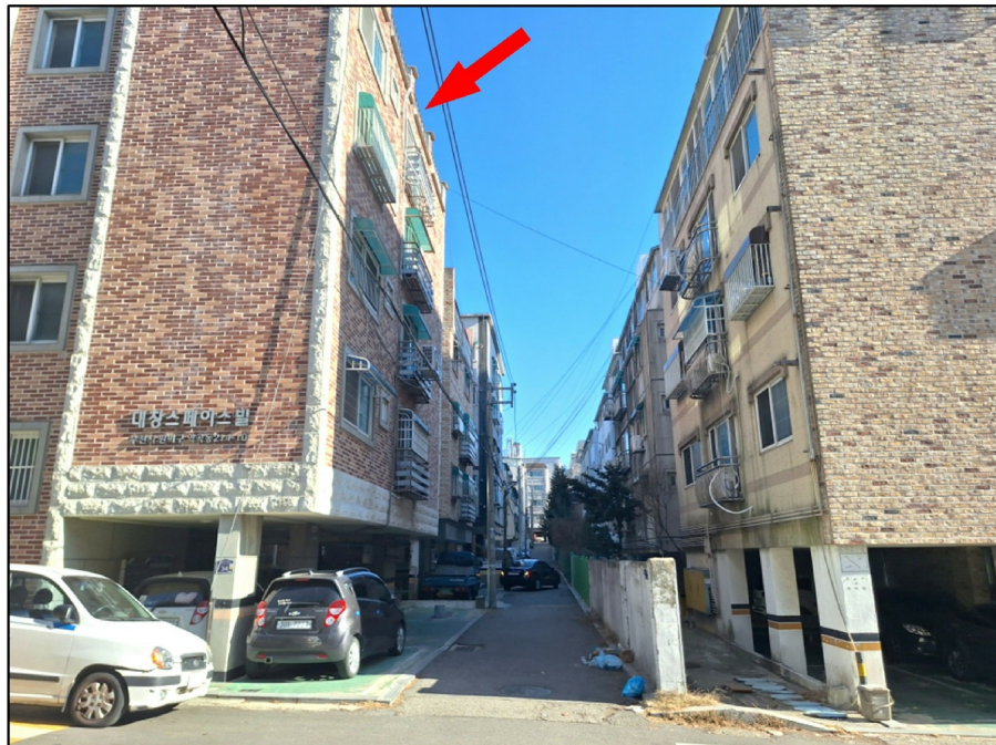
[ ( ) - ]