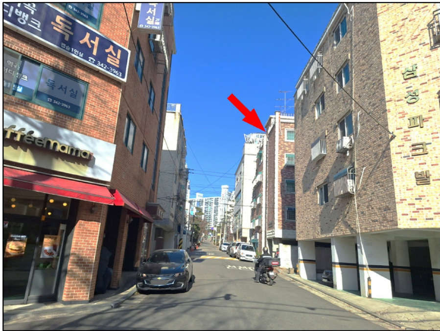
[ ( ) - ]