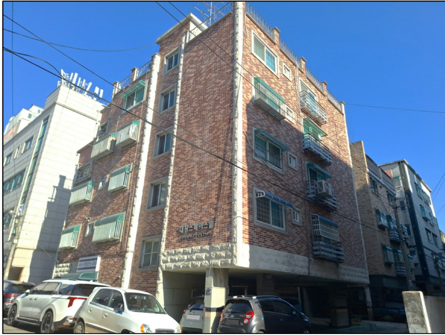
[ - ]