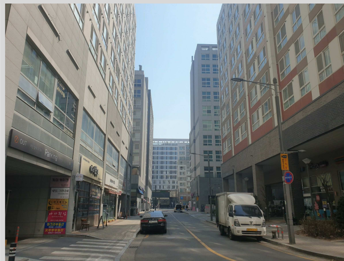
서측 접면 도로