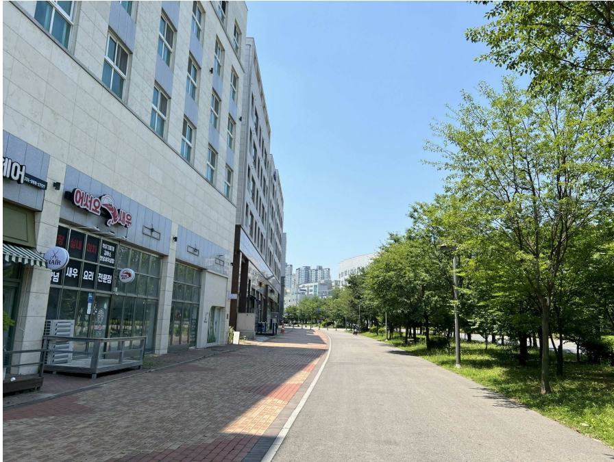
주변 전경 2