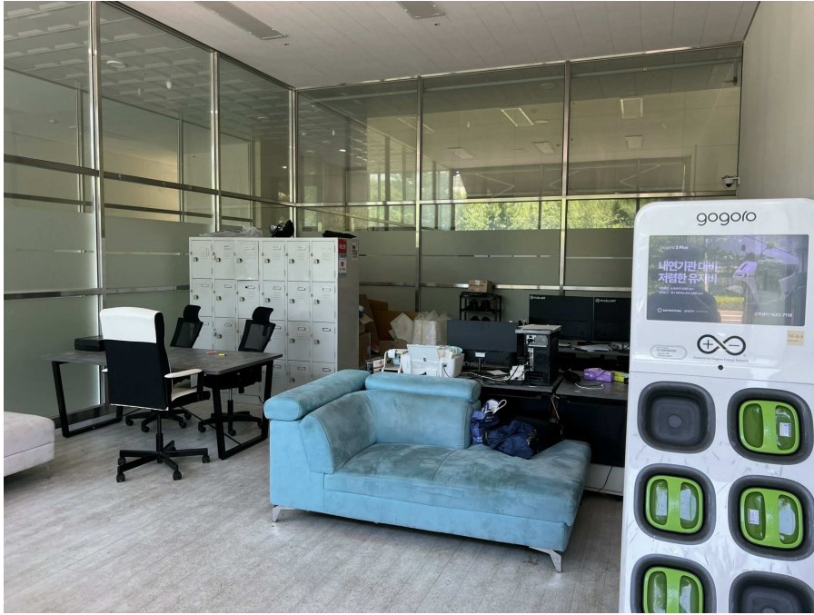
본건 내부 현황