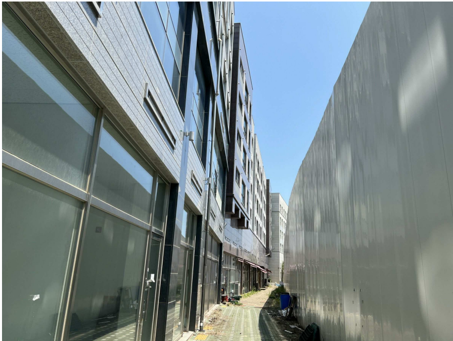
본건 남측 상가 부분 노선 현황