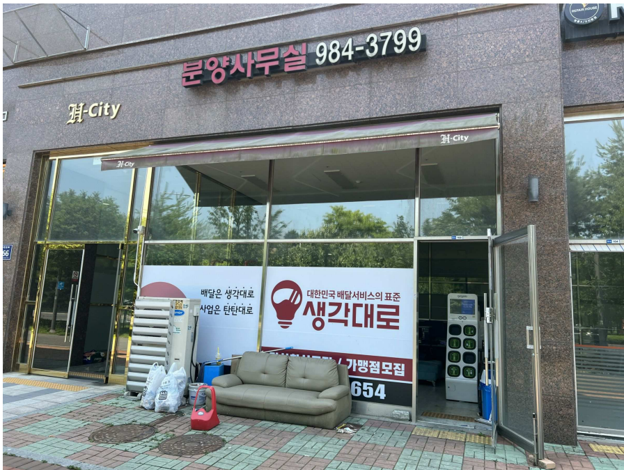
본건 외부 현황