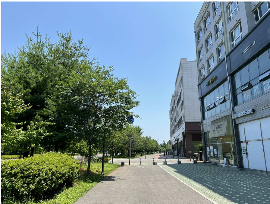
주변 전경 1