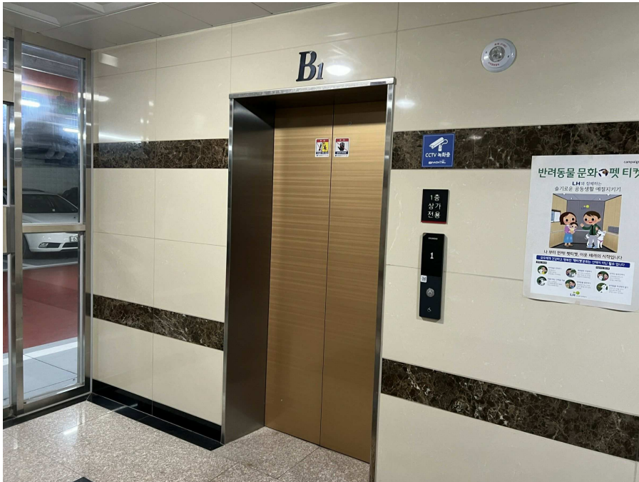
상가전용 승강기 부분