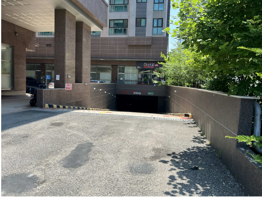
지하주차장 출입부 부분