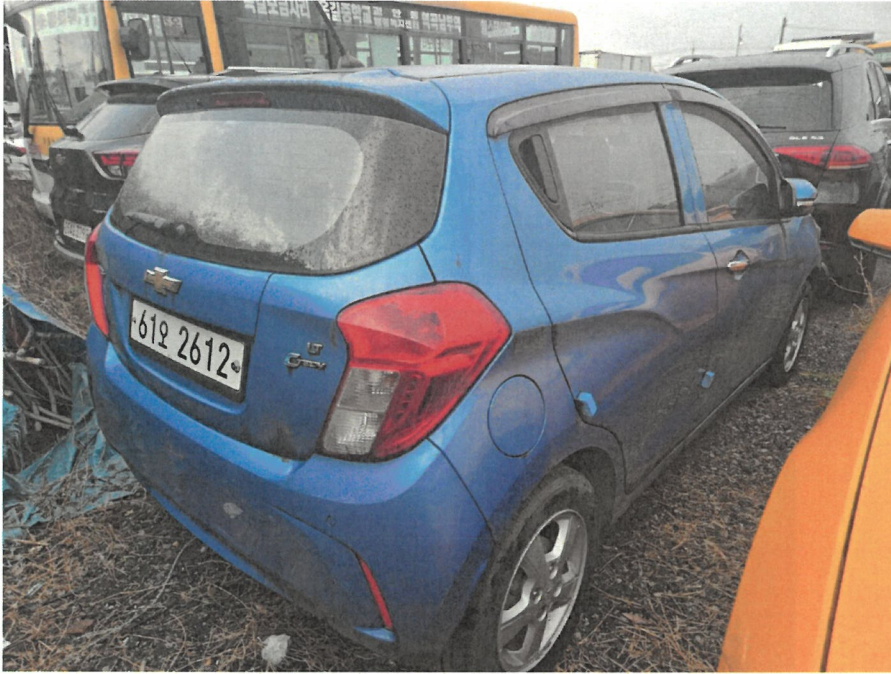
후면 및 측면 전경