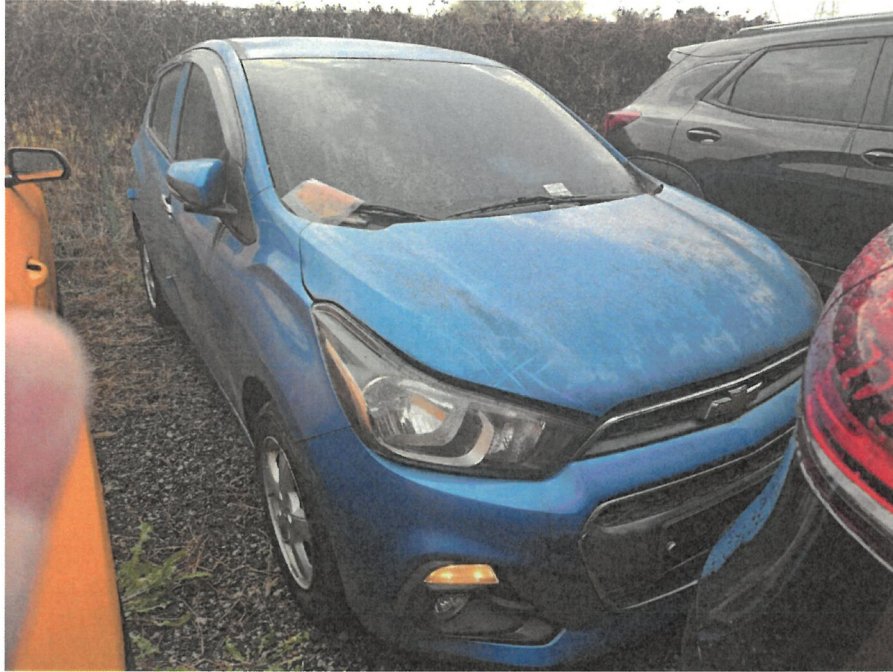
전면기준 좌측면 전경