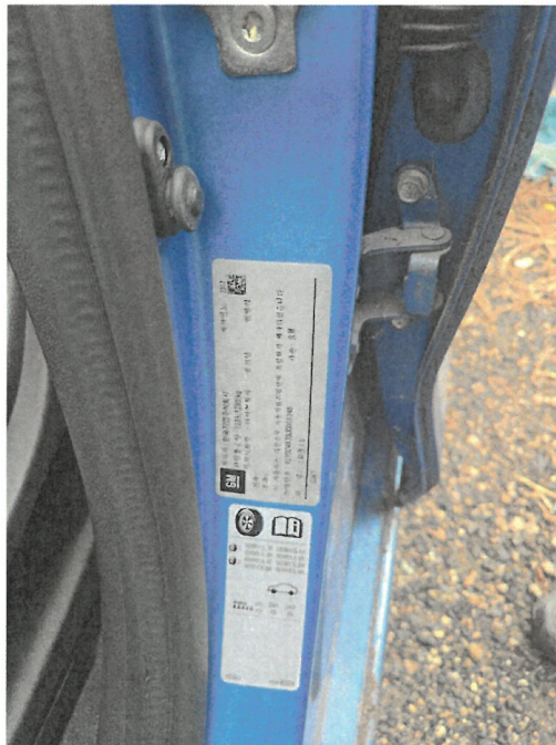
운전석 문에 표시된 차대번호 전경