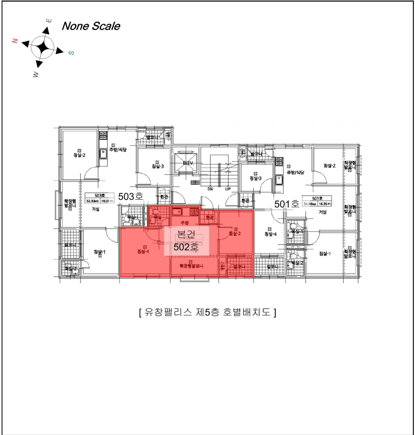
[ 유창팰리스 제5층 호별배치도 ]