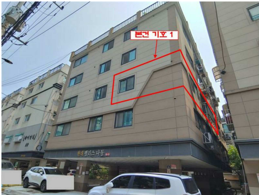
본건 전경(기호 1)