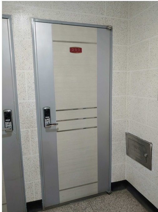
본건 현관 전경