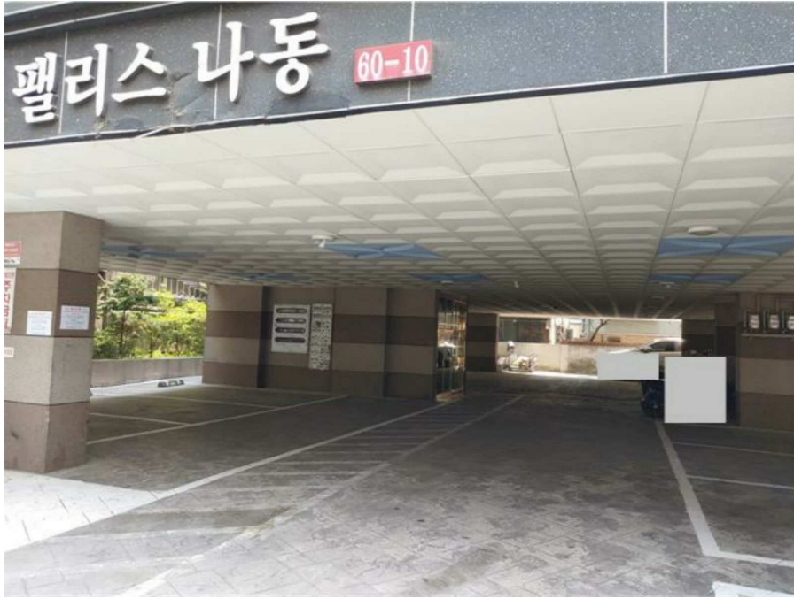
1층 주차장 및 공용출입구 전경