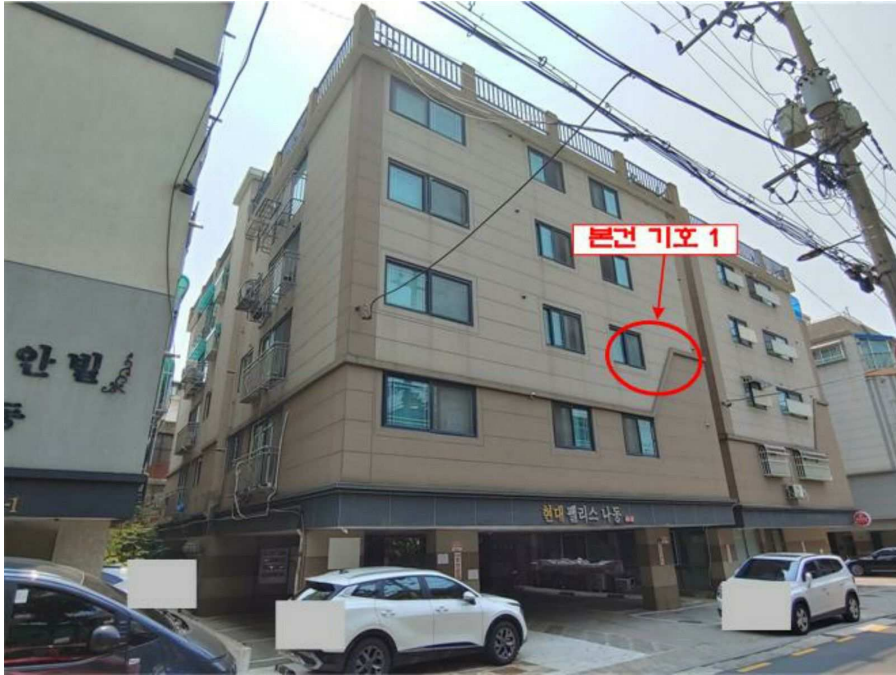
본건 전경(기호 1)