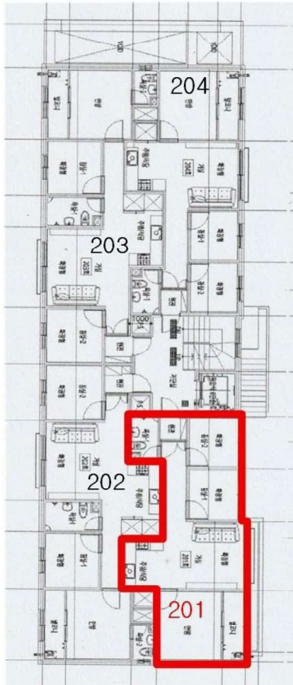
본건 < 라움힐스앤티라스 2층 201호 >