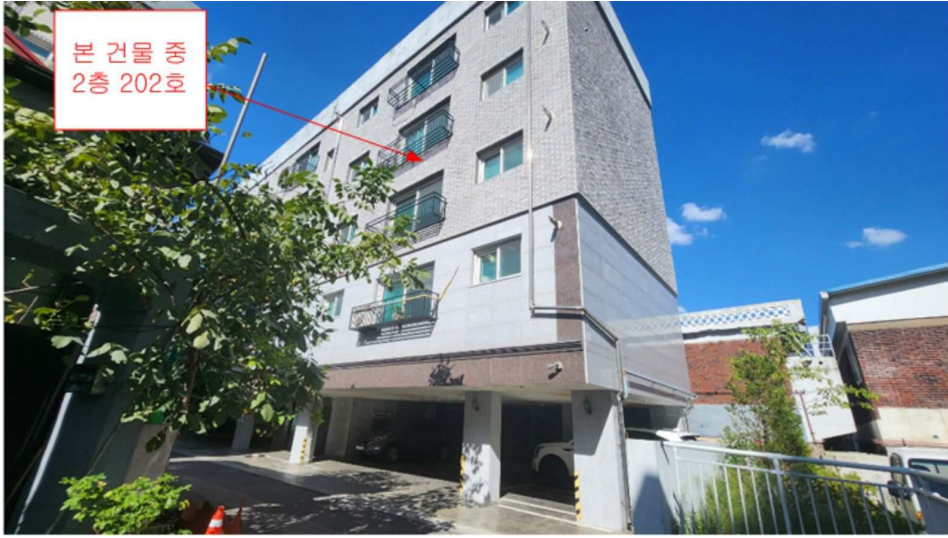
본건 소재 건물 전경