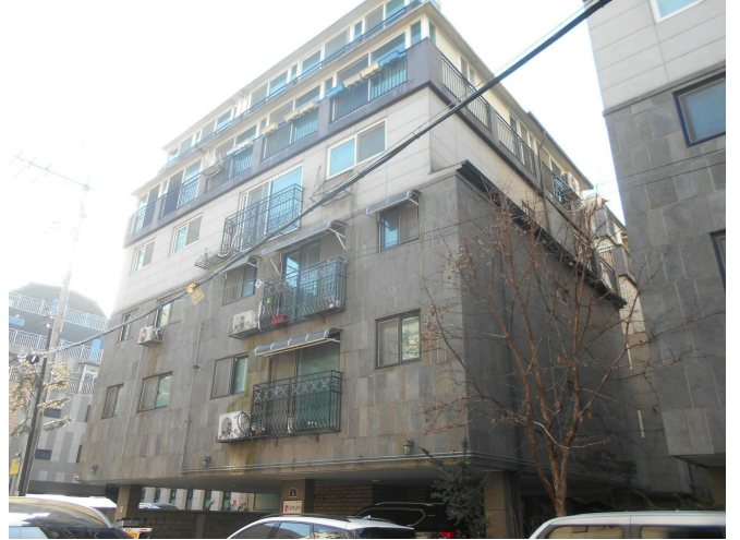
본건 전경2(북측 인근에서 촬영)