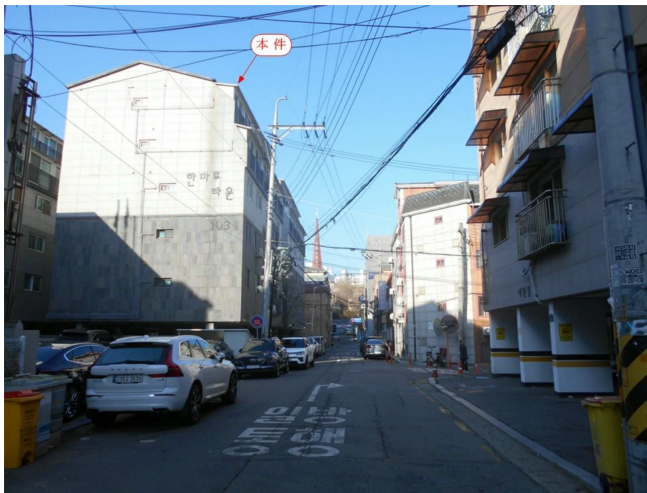
주변 전경(동측 인근에서 촬영)