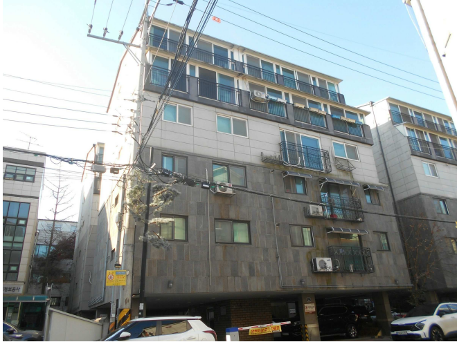
본건 전경1(북동측 인근에서 촬영)