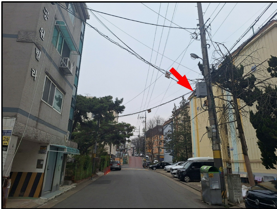
[ ( ) - ]