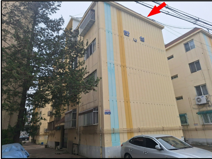
[ - ]