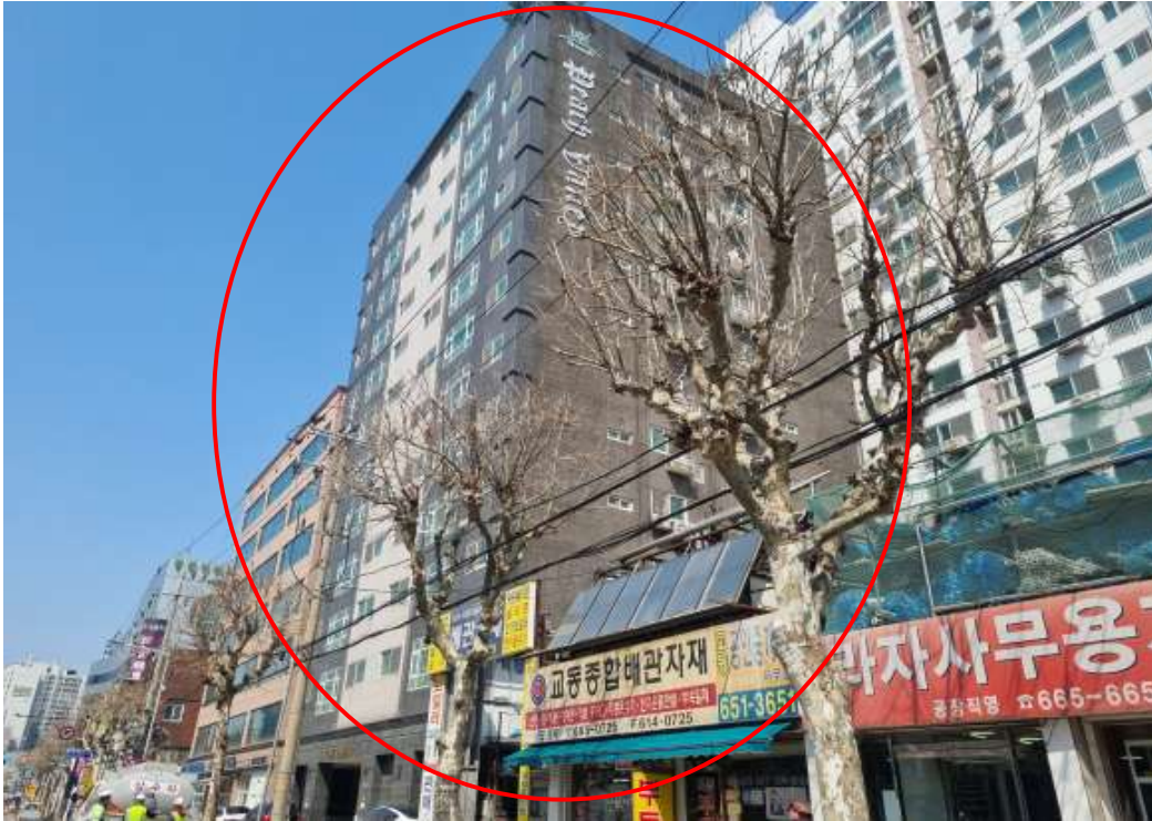
본건이 속한 건물 전경