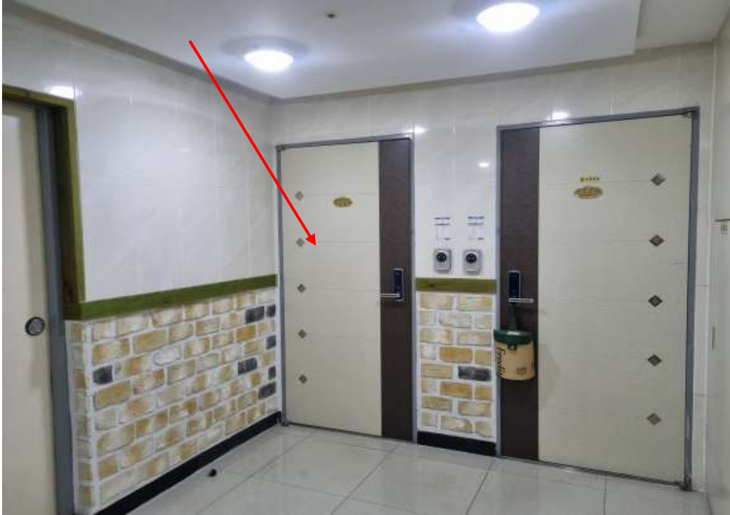
본건 복도 전경