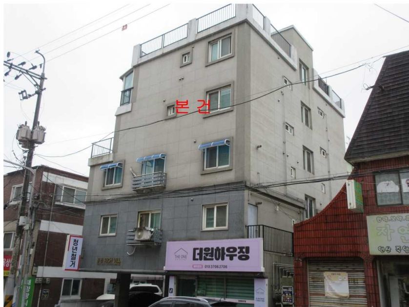
본건 전경 : 본건 [남서측]에서 촬영