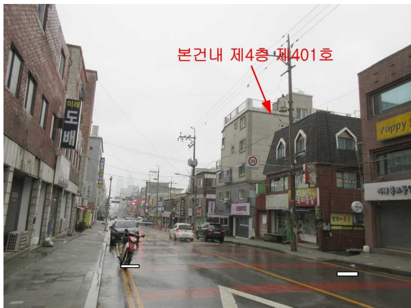
주위환경 : 본건 [남서측]에서 촬영