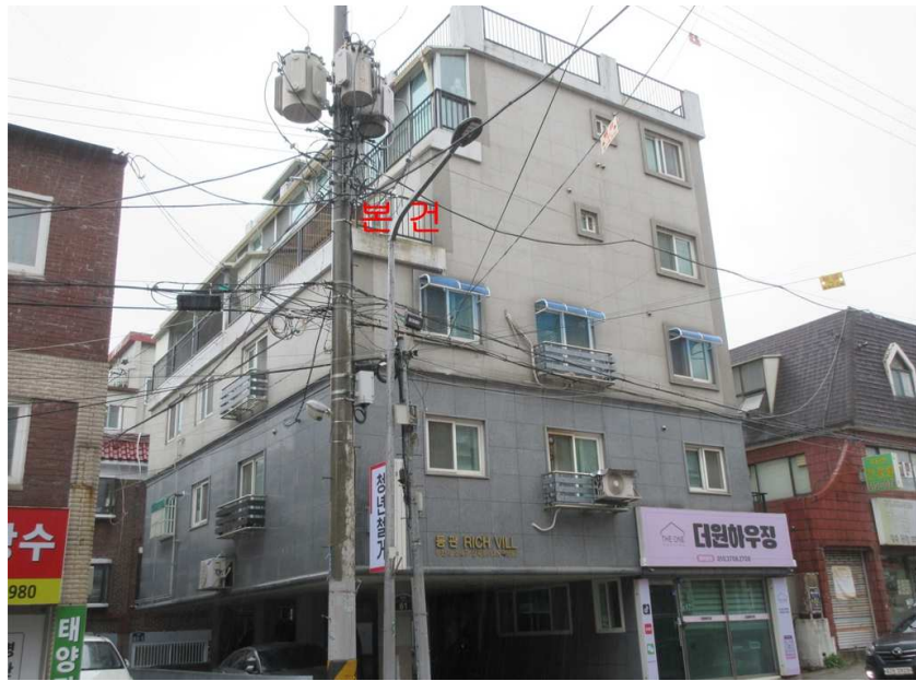
본건 전경 : 본건 [북서측]에서 촬영