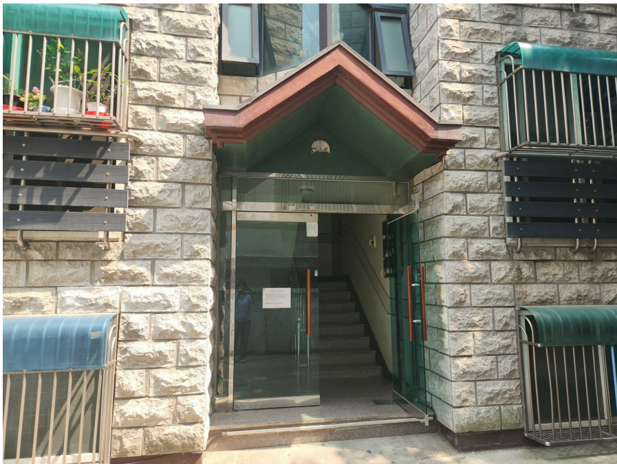
1층 공동출입문 전경