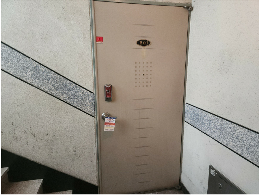
대상물건 나성빌라 지이호 출입문 전경