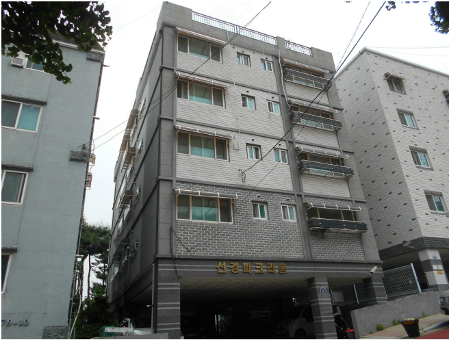
본건 전경1(남측 인근에서 촬영)