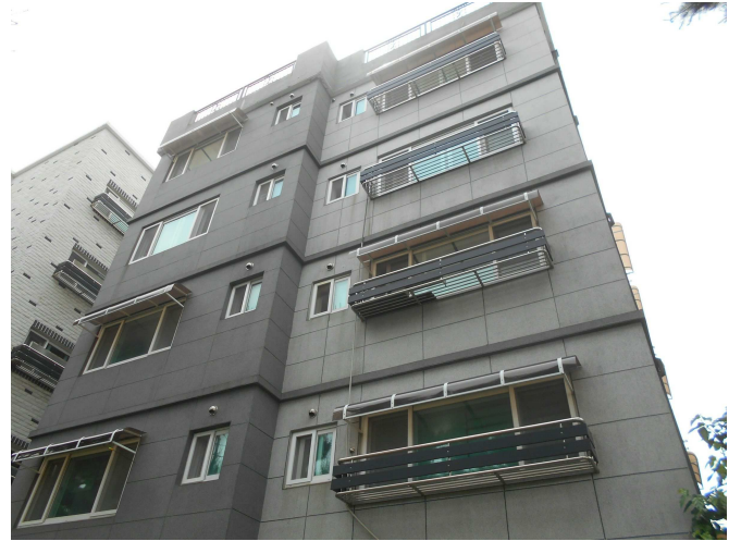
본건 전경2(북측 인근에서 촬영)