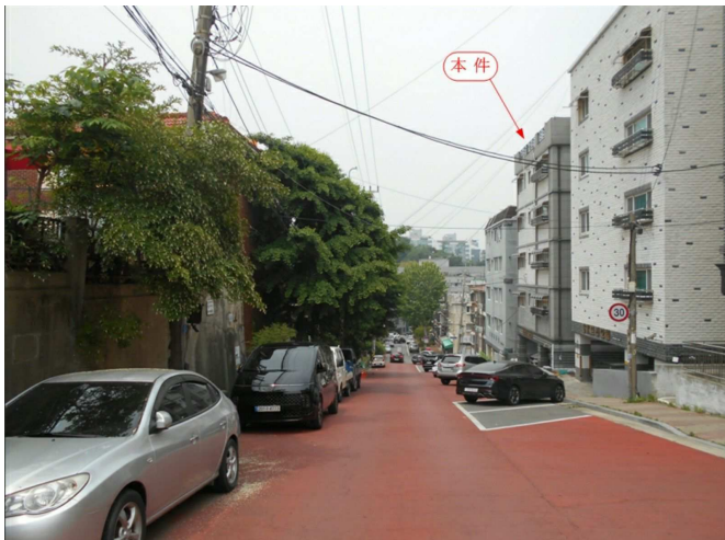
주변 전경(남동측 인근에서 촬영)