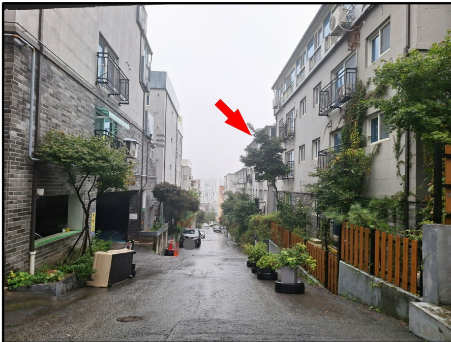
[ ( ) - ]