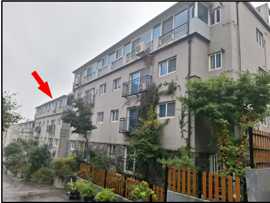
[ - ]