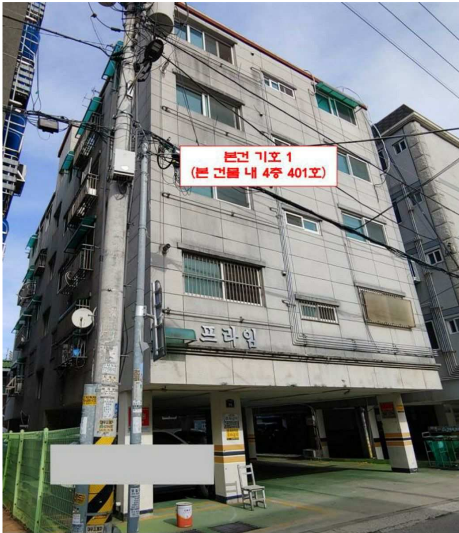
본건 전경(기호 1)