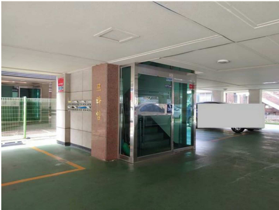
1층 공용출입구 전경