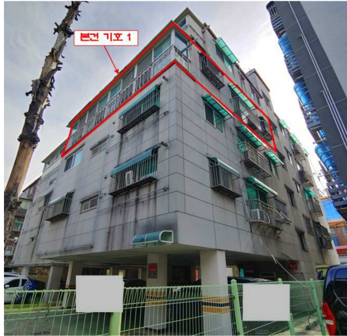
본건 전경(기호 1)