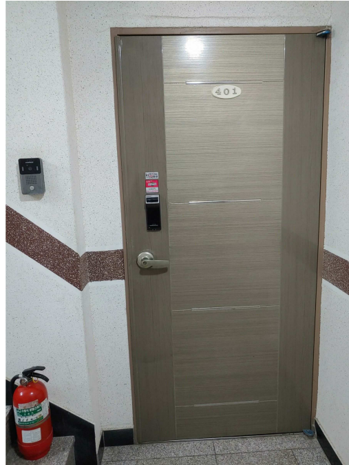
본건 현관 전경