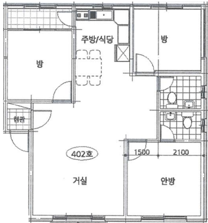
《제4층 제402호 내부구조도》