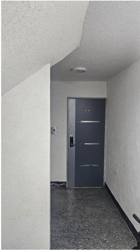
( 4 )