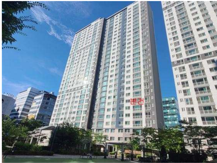
본건 전경 : 본건 [남동측]에서 촬영