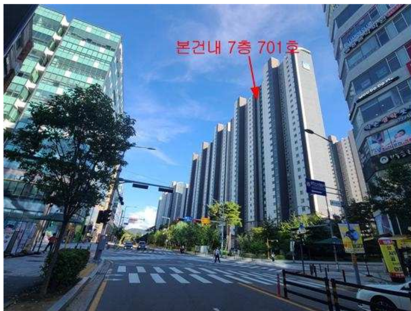
주위환경 : 본건 [북서측]에서 촬영