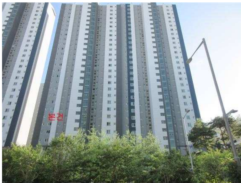
본건 전경 : 본건 [북측]에서 촬영