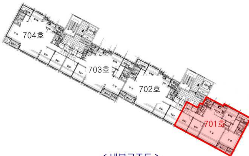
< 내부구조도 >