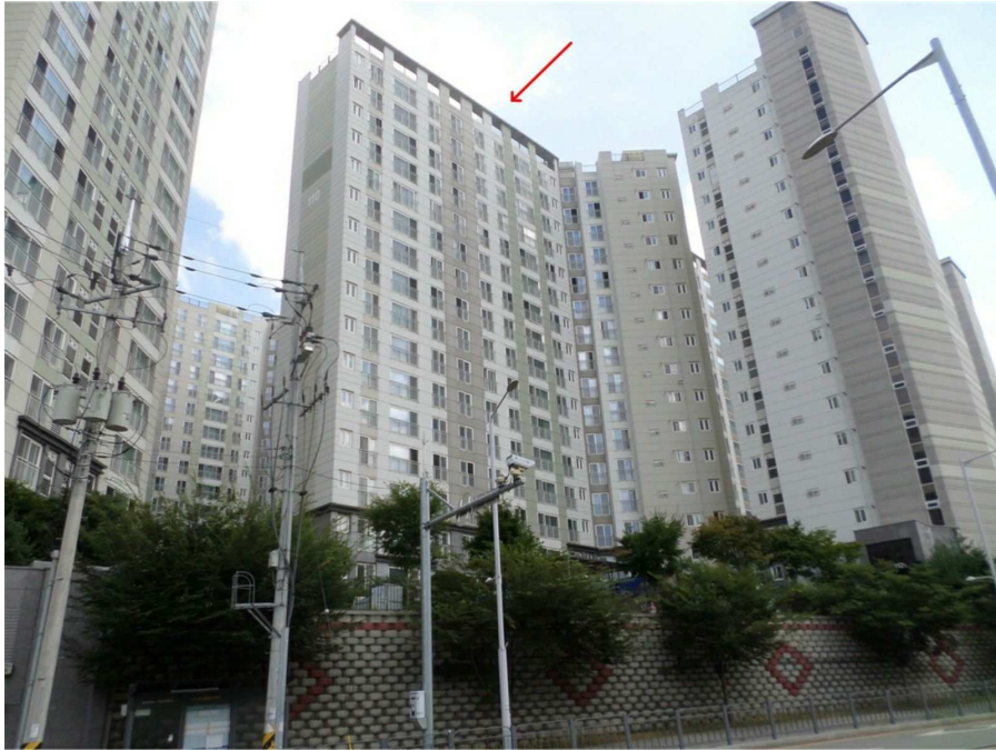
본건이 속한 건물의 전경