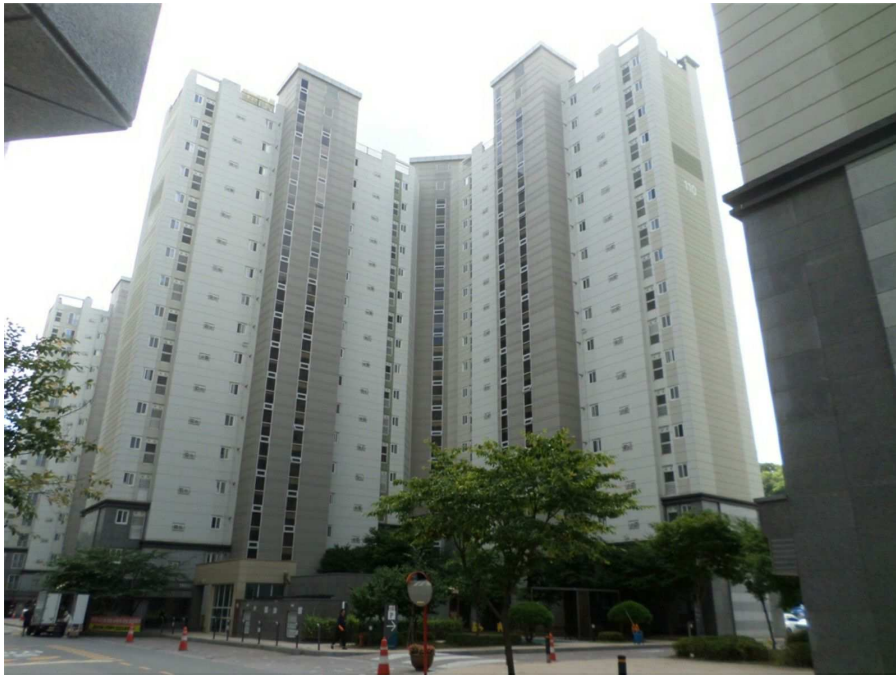
본건이 속한 건물의 전경