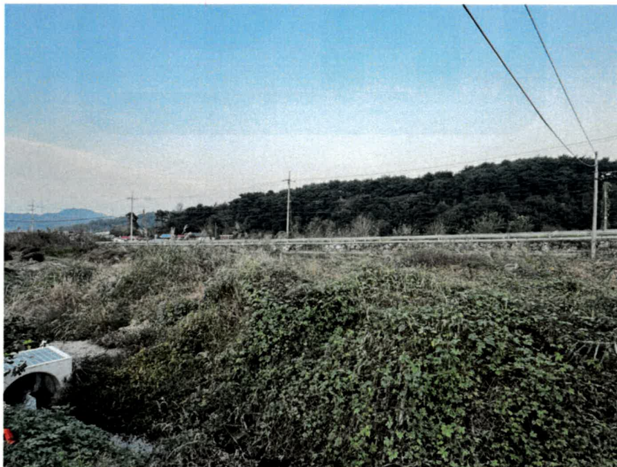
기호(1) 남서측 전경