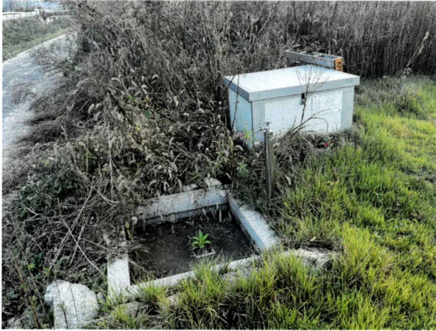
기호(2) 소재 제시외물건(ㄱ)