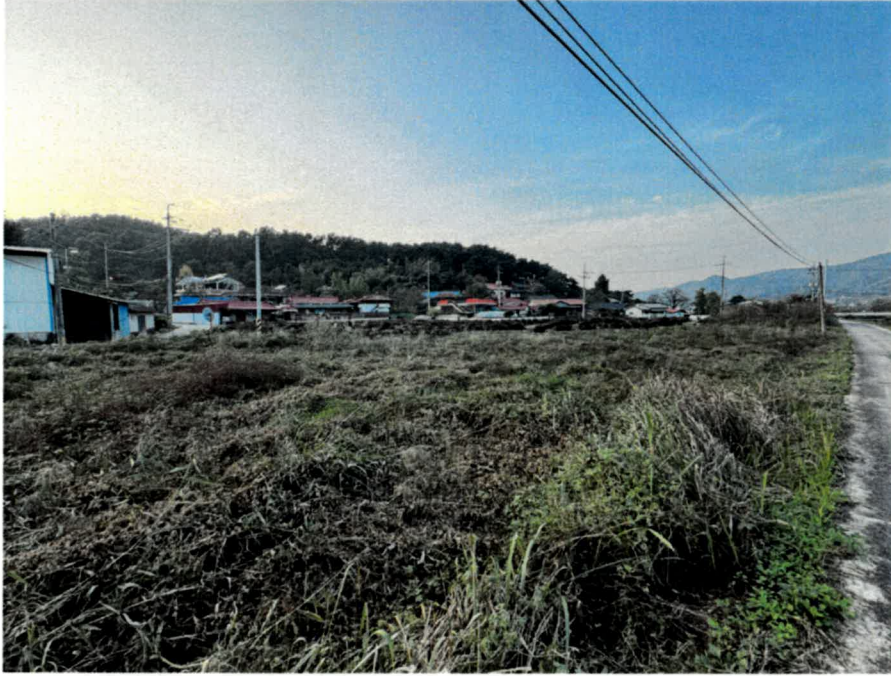
기호(1) 남동측 전경