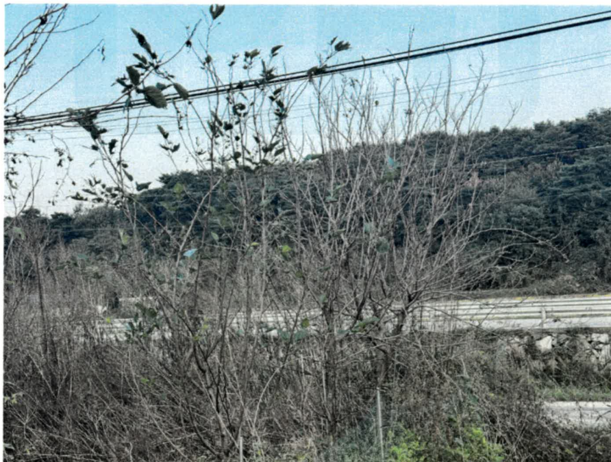
기호(2) 소재 제시외수목(ㄷ)