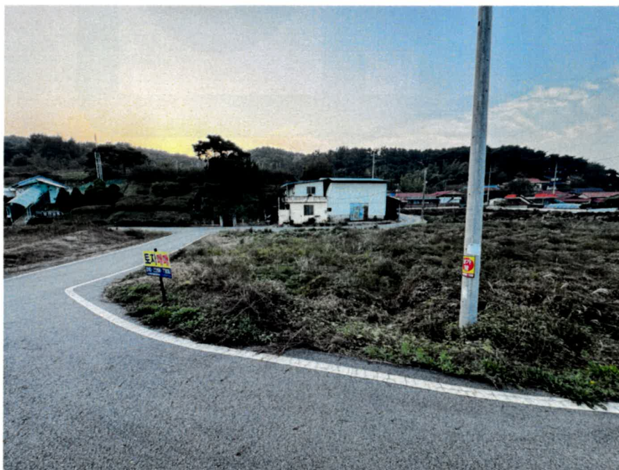
기호(3) 동측 전경