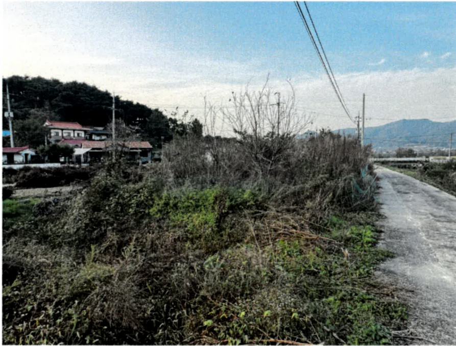
기호(2) 남동측 전경