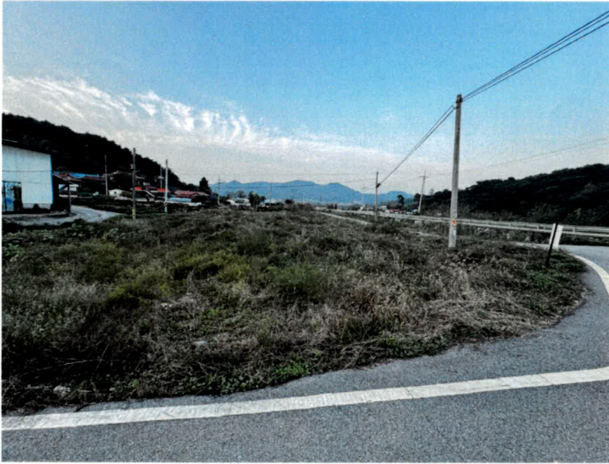
기호(3) 남측 전경