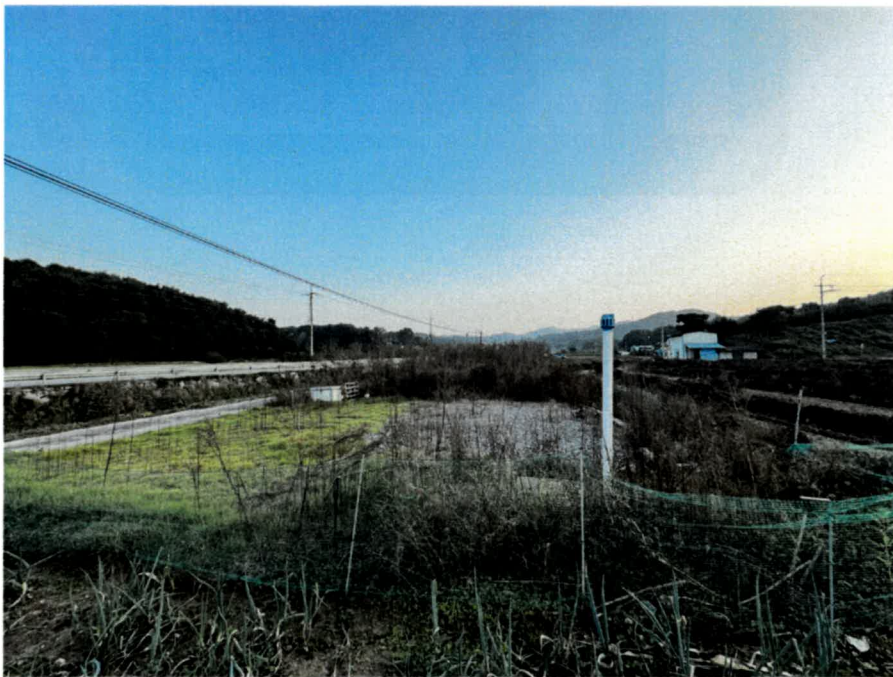
기호(2) 북측 전경