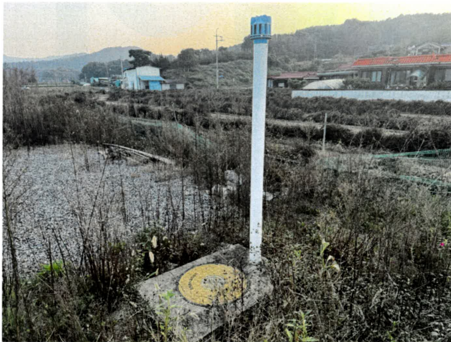
기호(2) 소재 제시외물건(ㄴ)