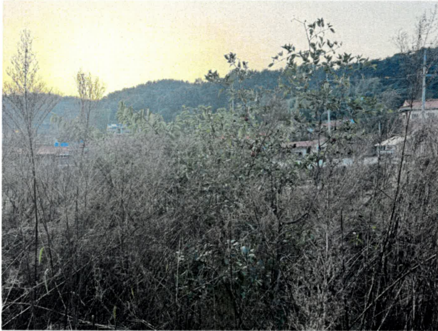
기호(2) 소재 제시외수목(ㄷ)