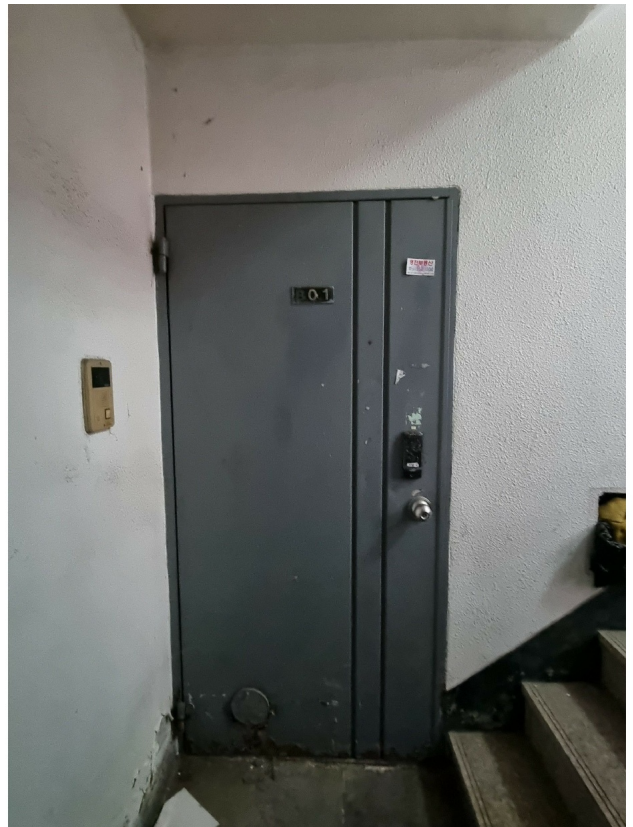
( 1 )