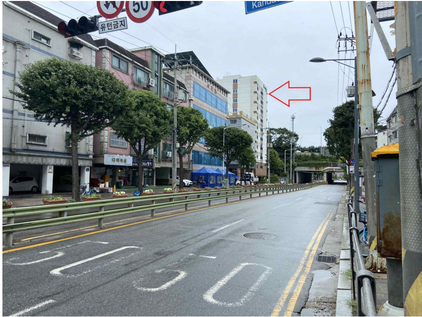
주위환경 (북측에서 촬영)