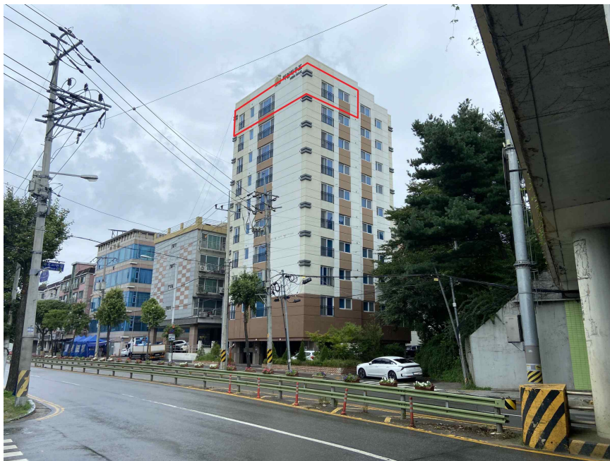
대상물건 전경 (남서측에서 촬영)