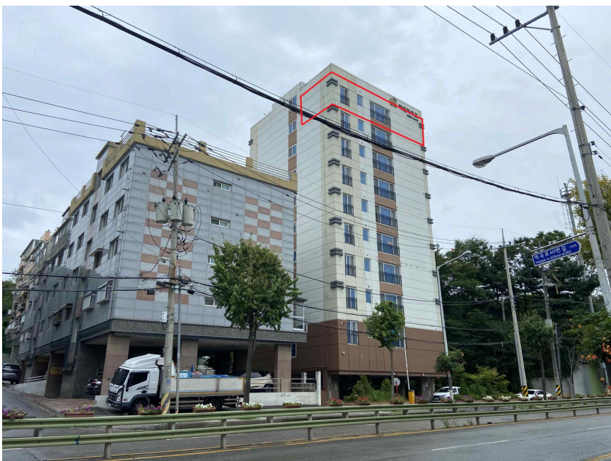
대상물건 전경 (북서측에서 촬영)