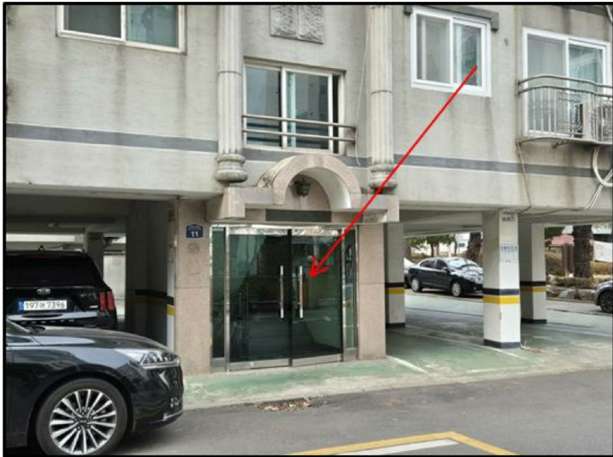
[ 1 ]