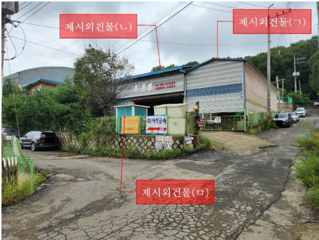
(1), ( ), ( ), ( )