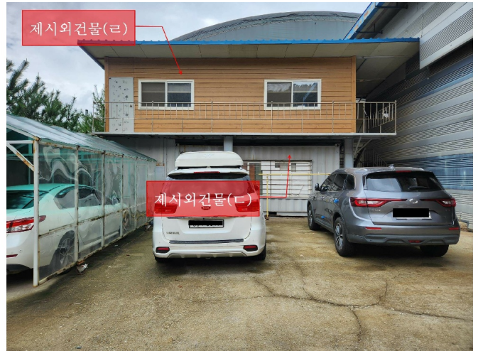
( ), ( )