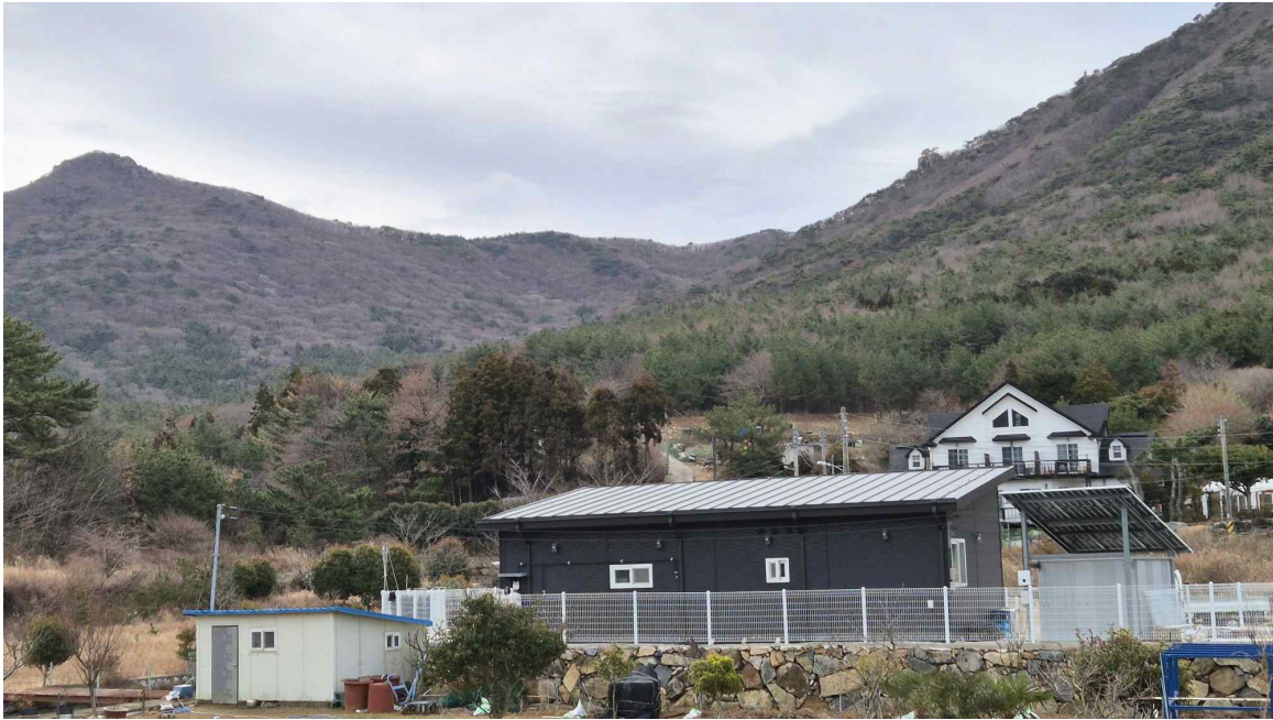
[ 본건 원경: 기호 ①, ② ]