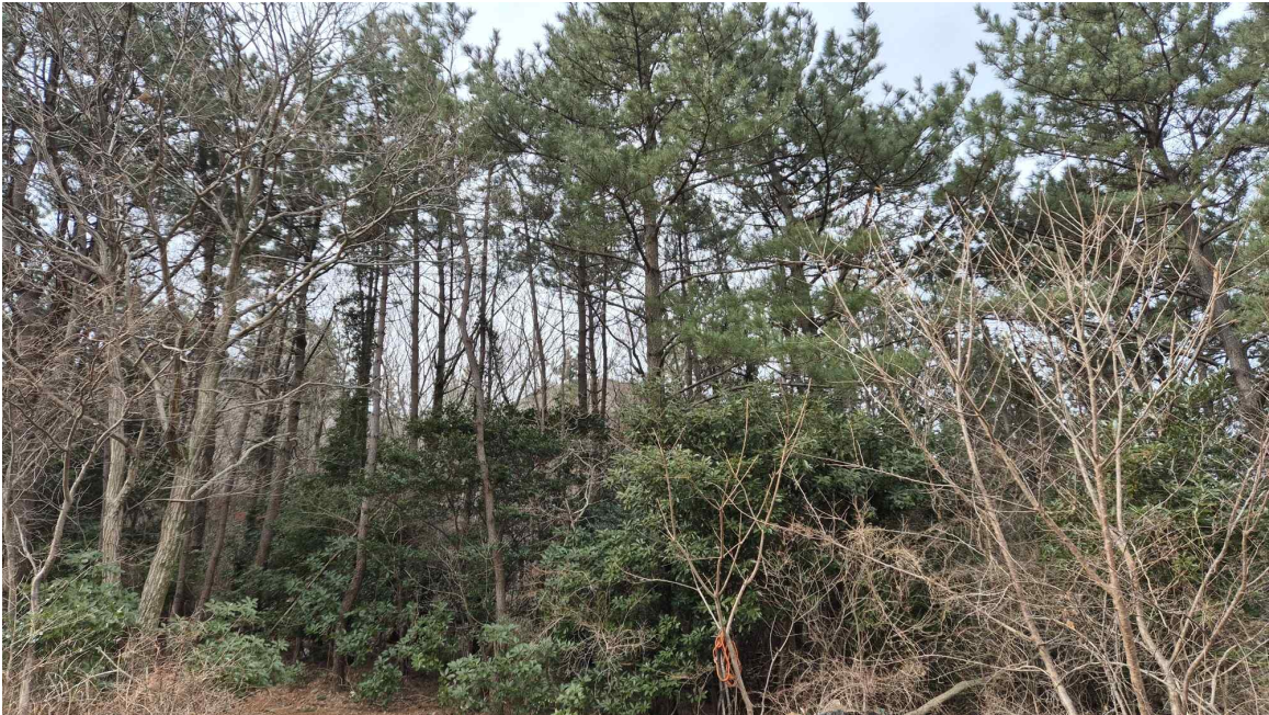
[ 본건 전경: 기호 ② ]