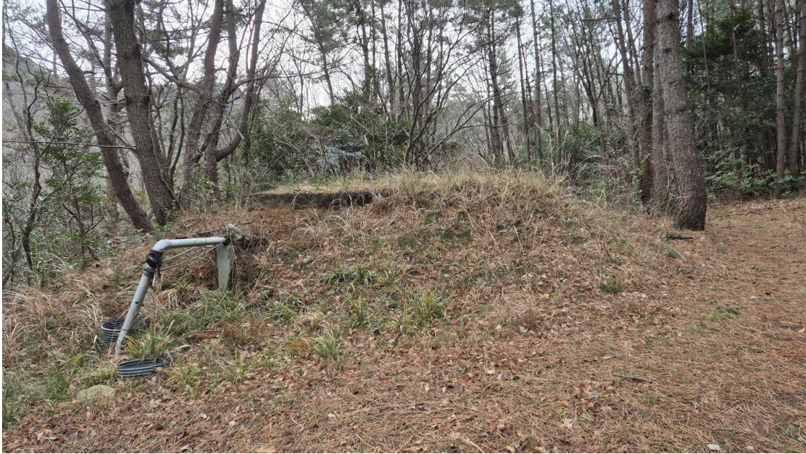
[ 제시외 건축물: 기호 ① 지상 ]