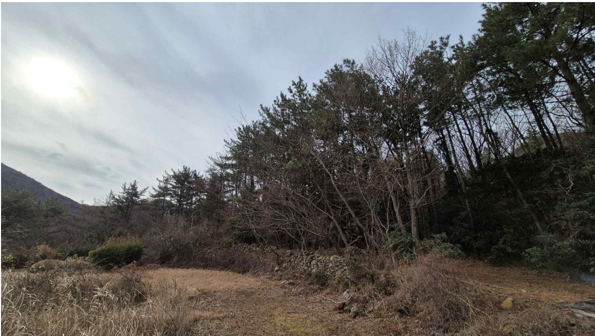
[ 본건 전경: 기호 ① ]