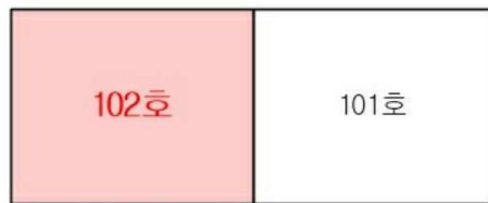
< 호별배치도 >