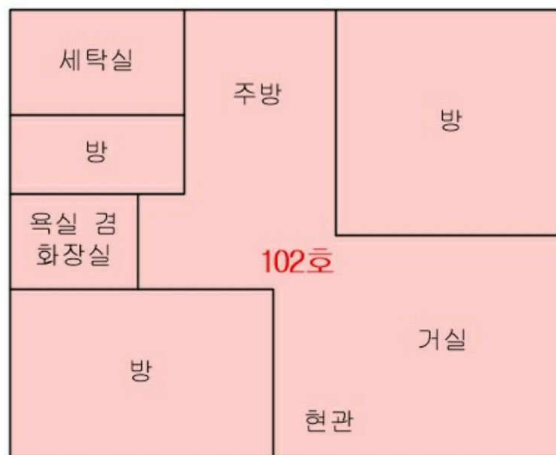
< 내부구조도 >