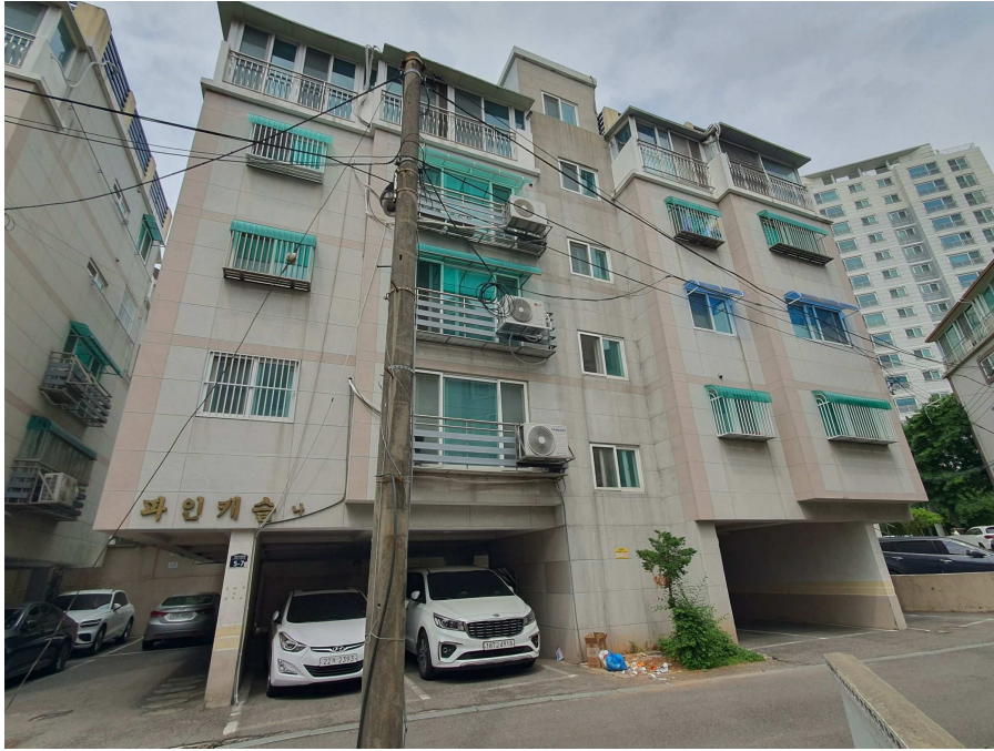
본건 소재 건물 전경