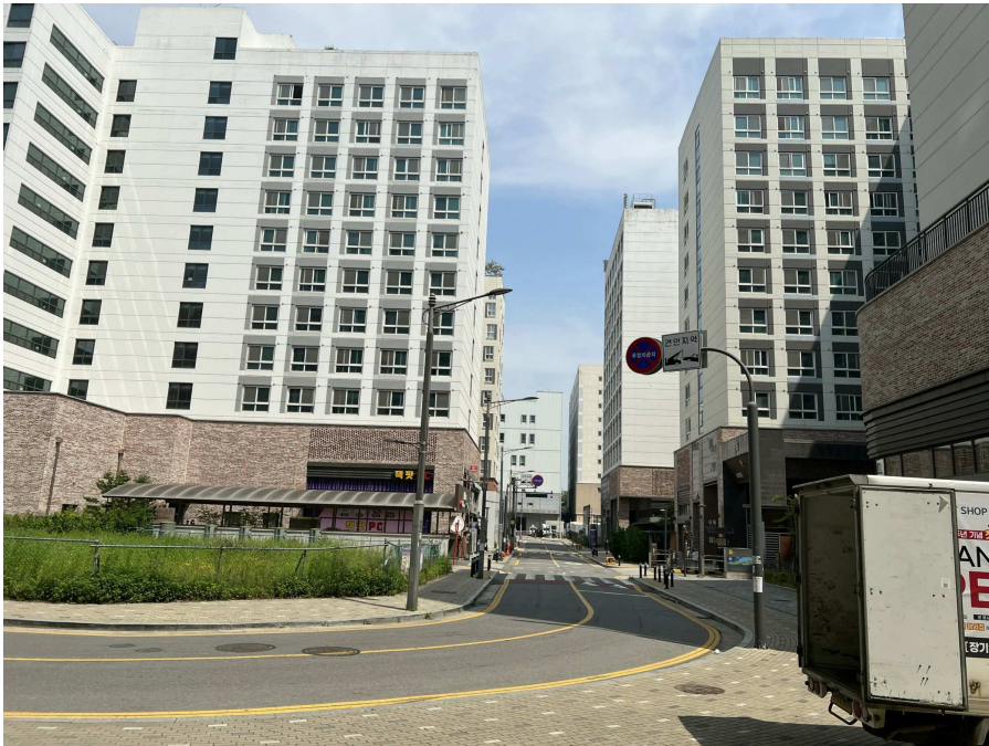
주변 전경 2