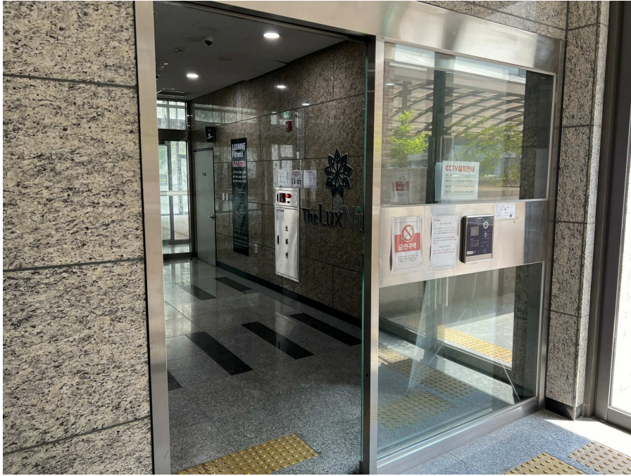
1층 출입부 현황