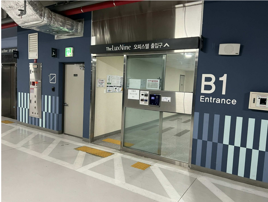
지하층 출입부 현황