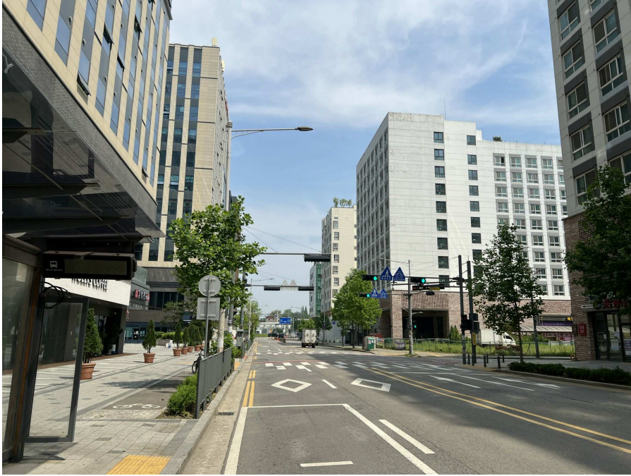
주변 전경 1