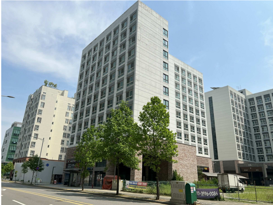
본건 전경 1