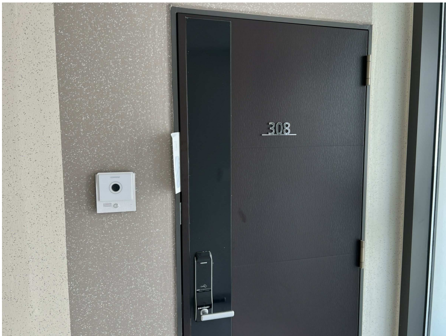
본건 외부 현황