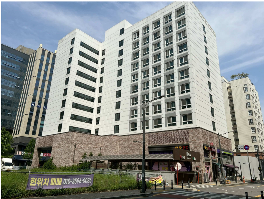
본건 전경 2