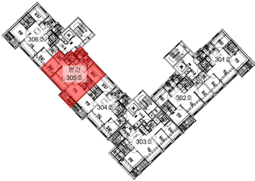
[ 김포사우아이파크 제109동 제3층 호별배치도 ]