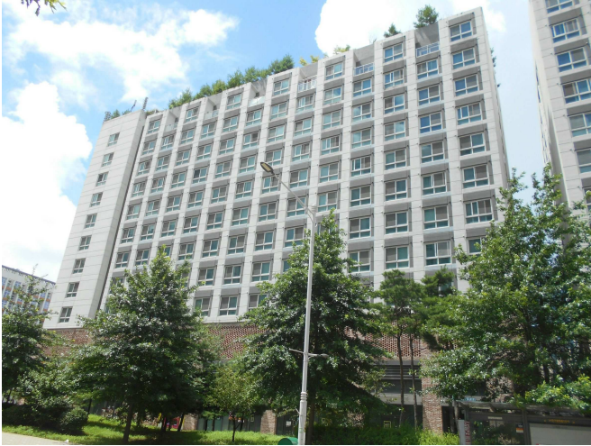
본건 전체 건물 전경(동측 인근에서 촬영)