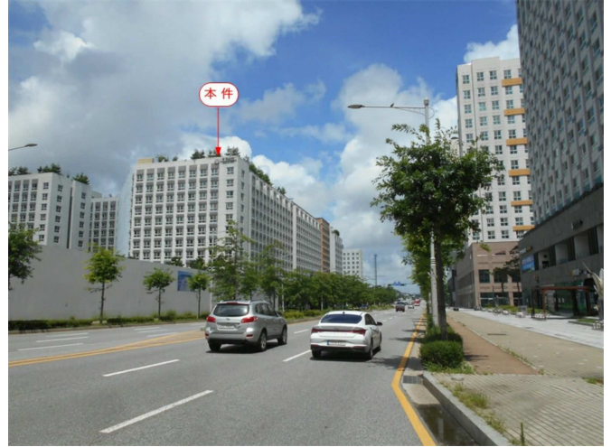
주변 전경(남동측 인근에서 촬영)