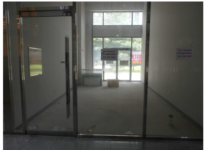
109호 내부 전경