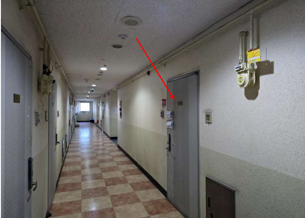
본건 복도 전경