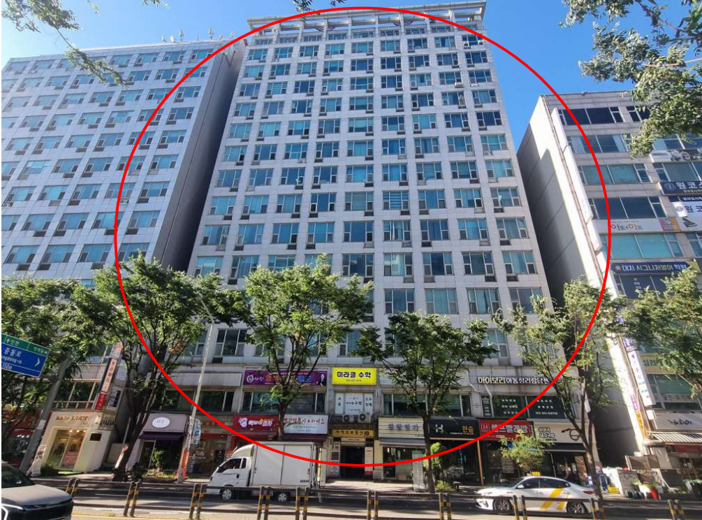
본건이 속한 건물 전경