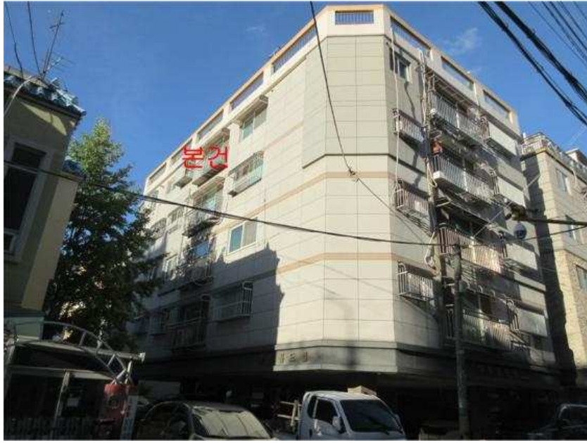
본건 전경 : 본건 [남서측]에서 촬영