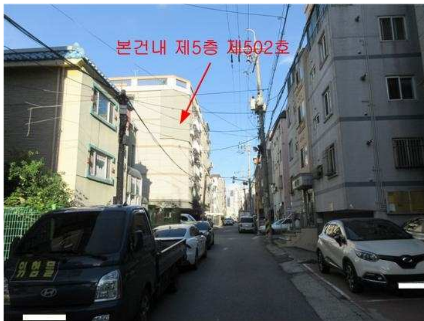
주위환경 : 본건 [남서측]에서 촬영