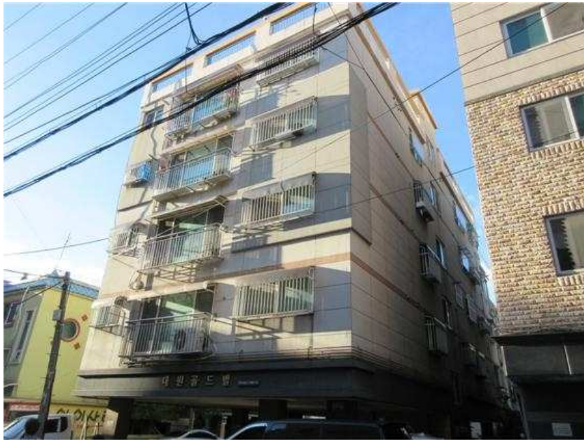
본건 전경 : 본건 [남동측]에서 촬영