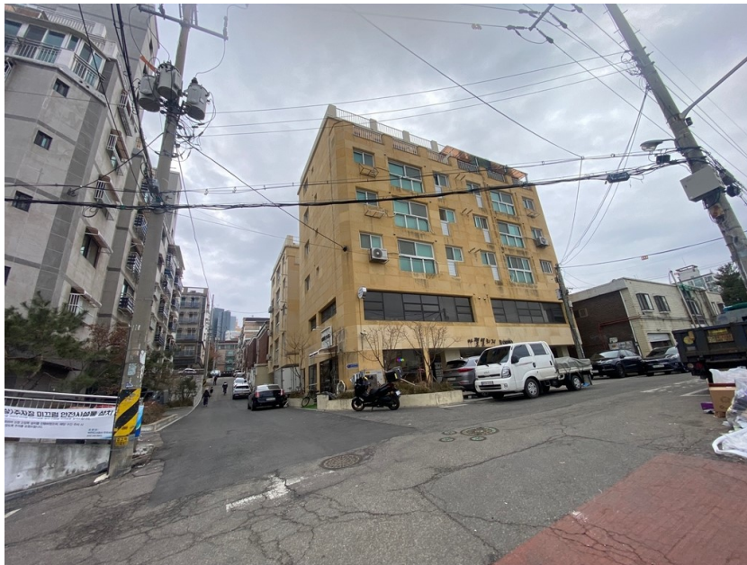
본건 및 주변전경