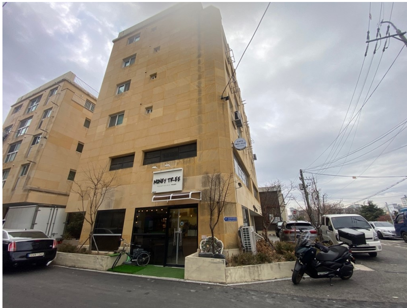
본건 및 주변전경