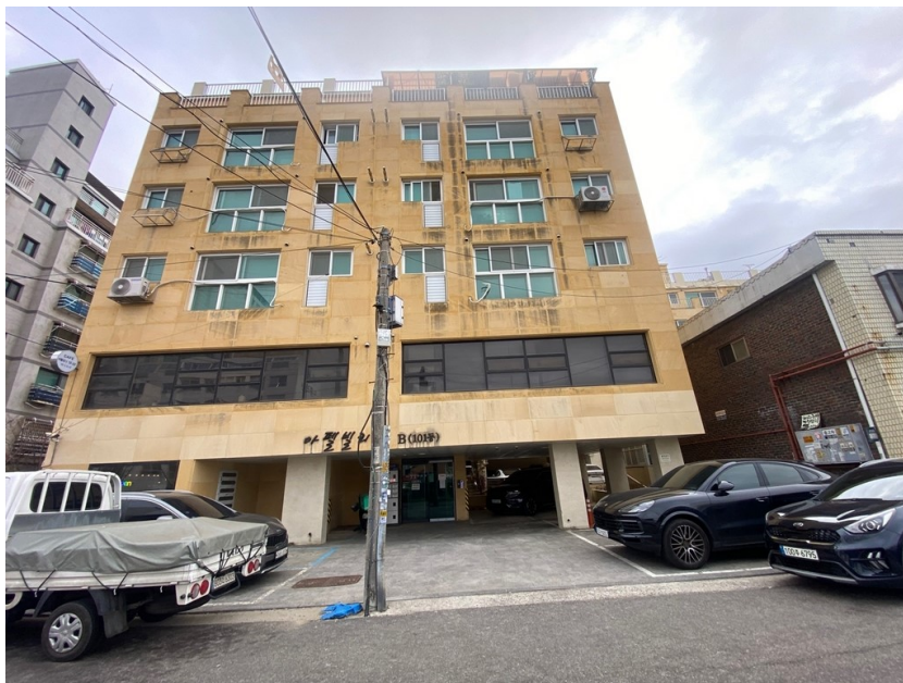
본건 및 주변전경