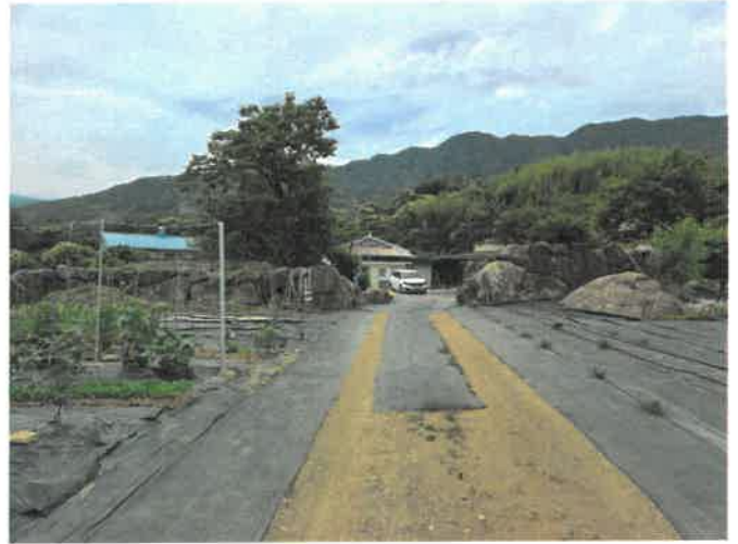
본건 일부 전경