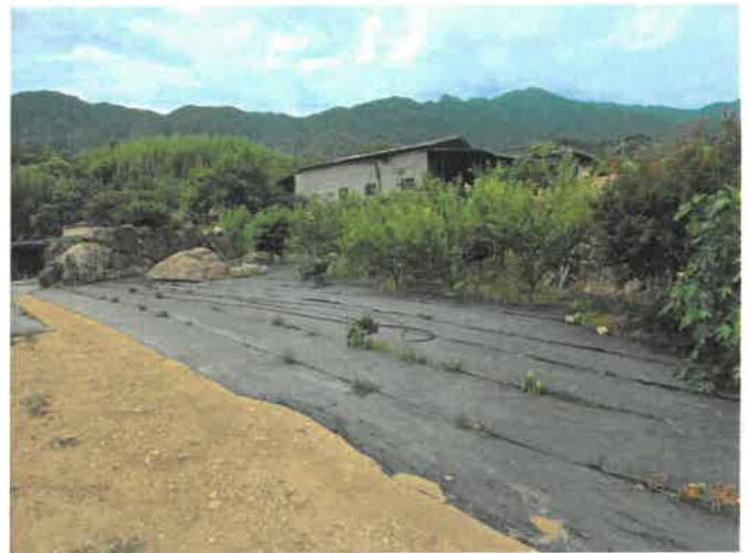
본건 일부 및 제시외수목 전경