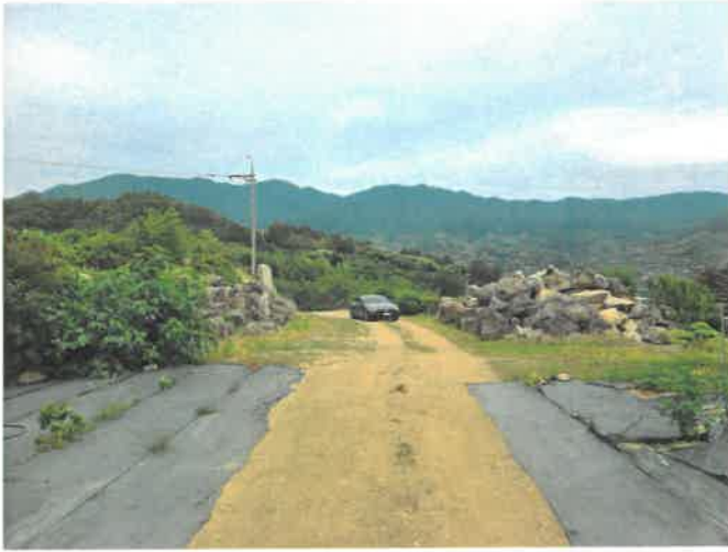
본건 일부 전경