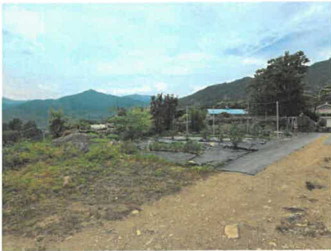
본건 일부 전경