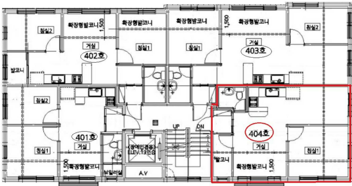
호별배치도 및 내부구조도