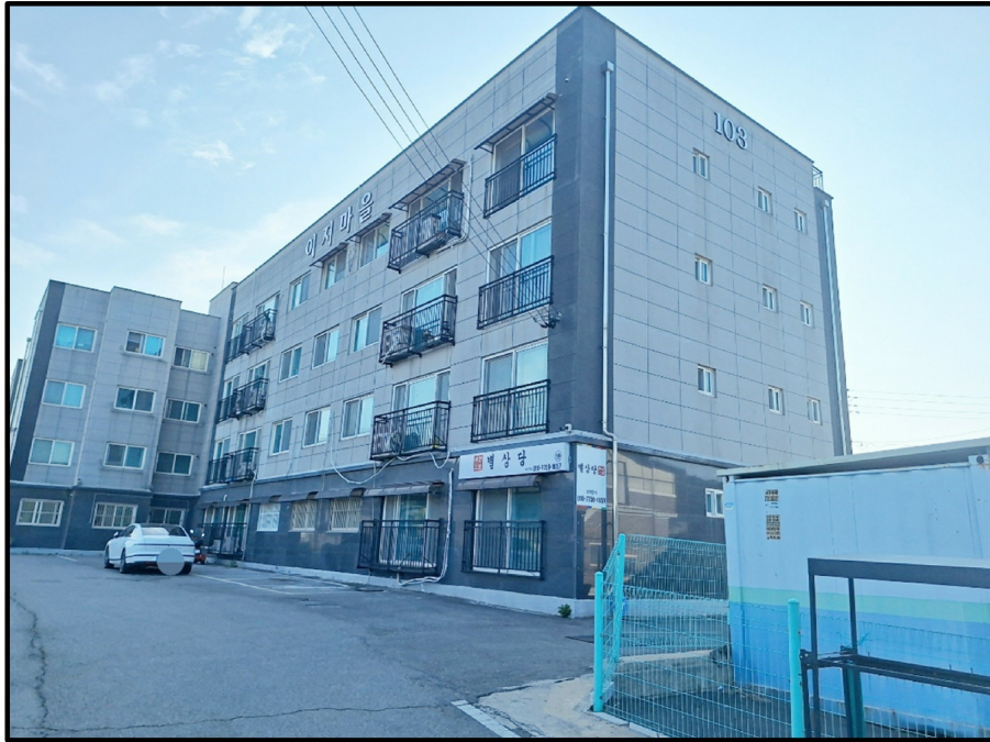
[ - ]