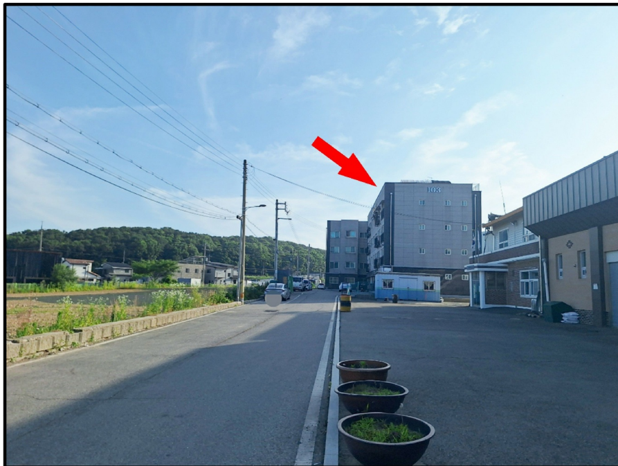
[ ( ) - ]