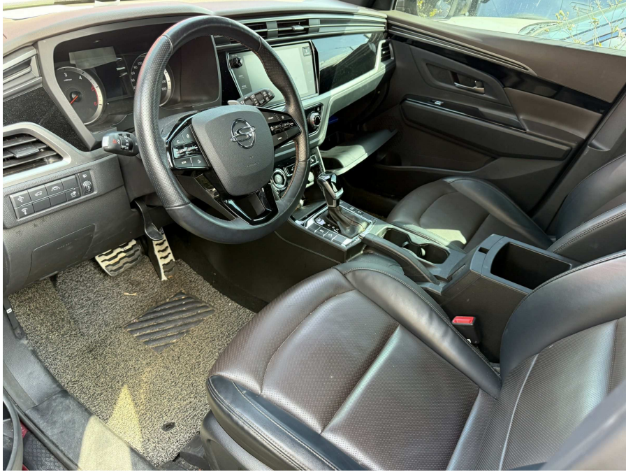
차량 내부 1