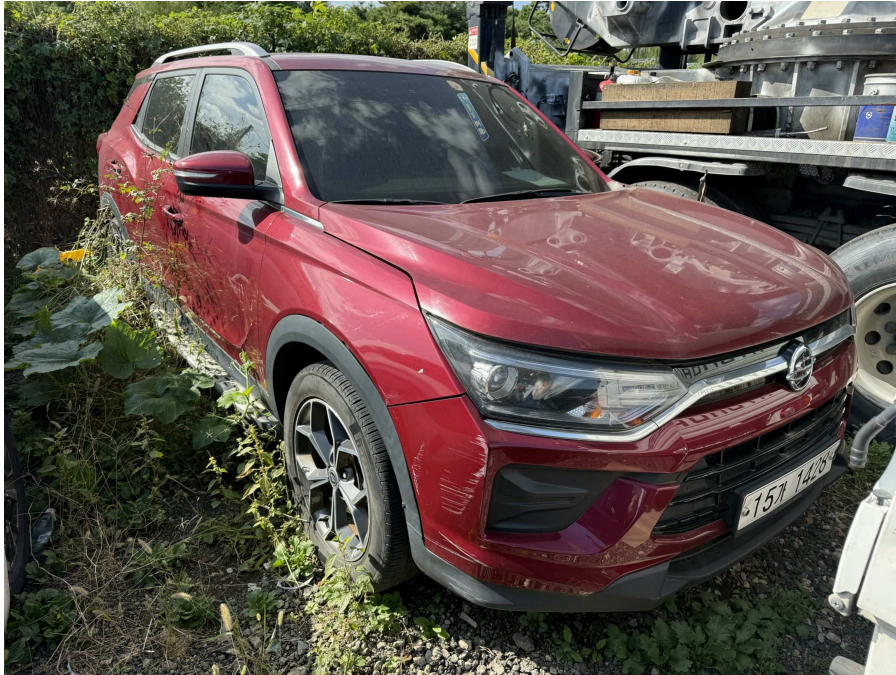
차량 전면부 1