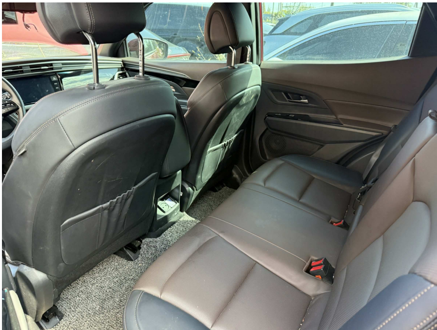
차량 내부 2