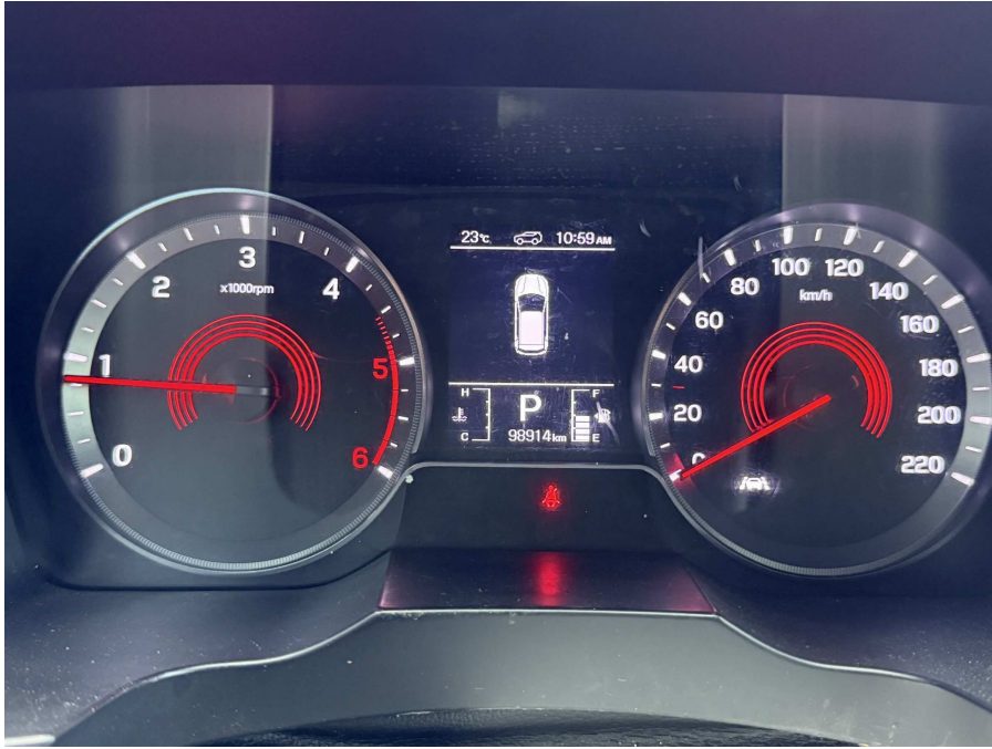
차량 계기판 부분