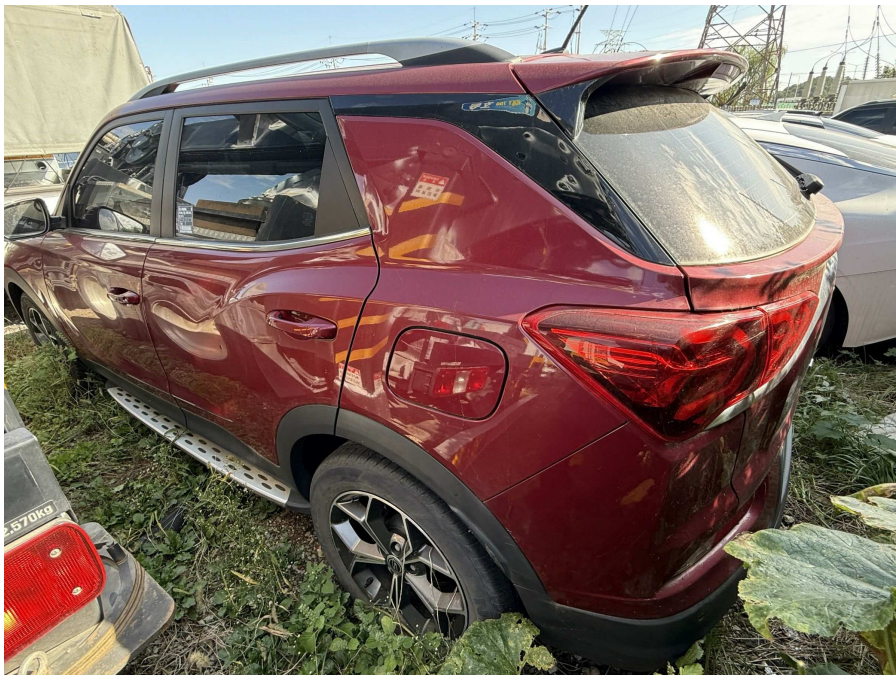
차량 후면부 2