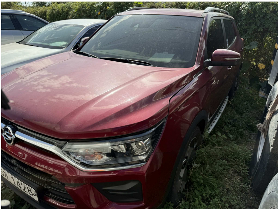
차량 전면부 2