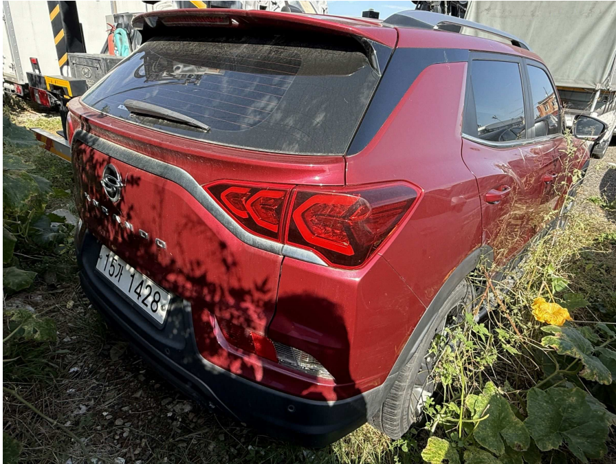
차량 후면부 1