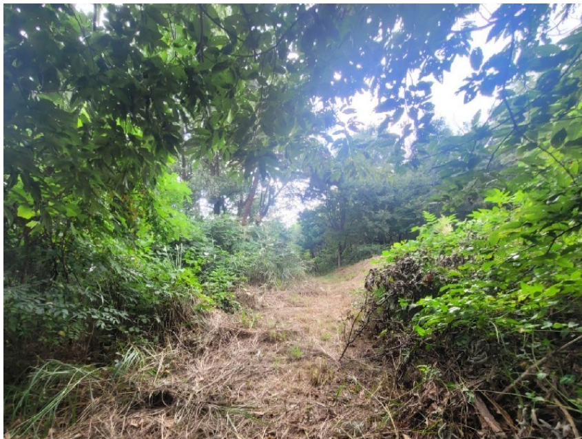
【본건 내부 진입로 전경】