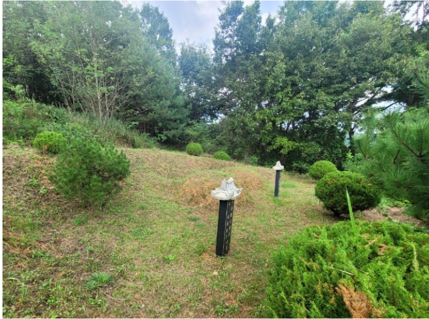
【분묘 2기 전경】